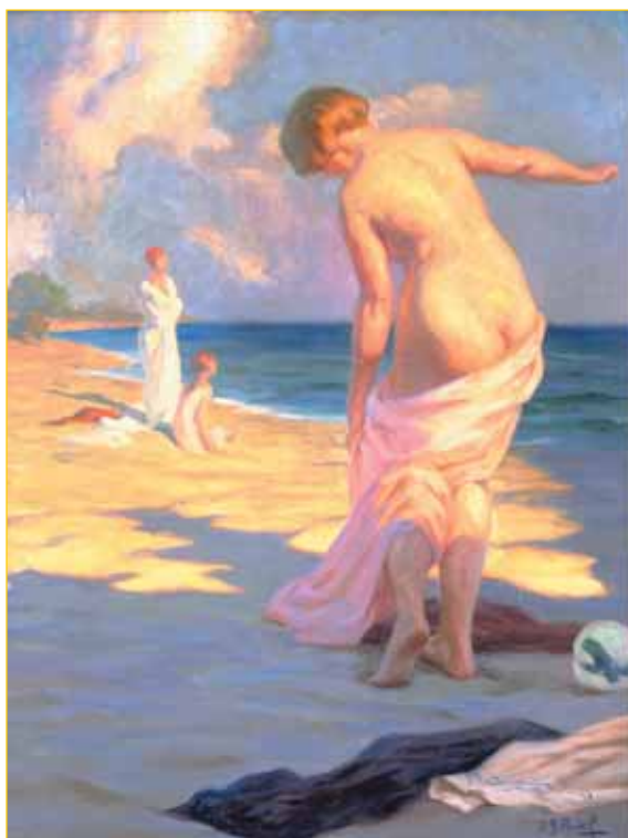
Rive Latine (étude) 1927, coll. part., Montpellier

tion savante de la lumière associée à une palette de tons très reconnaissables. Je crois que ce fut la principale manifestation de son talent. Un apprentissage très académique qui a su toutefois donner naissance à une peinture très chaleureuse. ■