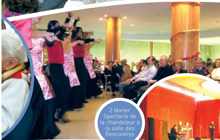
2 février Spectacle de la chandeleur à la salle des Rencontres