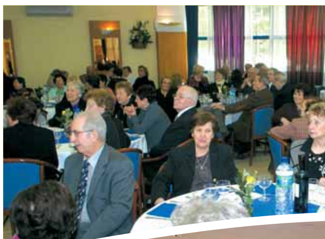
31 décembre Ambiance flamenco pour le réveillon de l'Age d'Or à Blanes