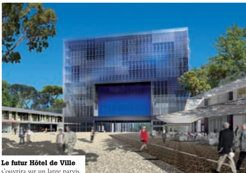
Le futur Hôtel de Ville s’ouvrira sur un large parvis.