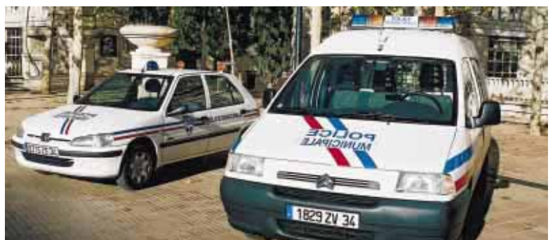
Tous les véhicules de la police municipale sont maintenant aux normes de la police.