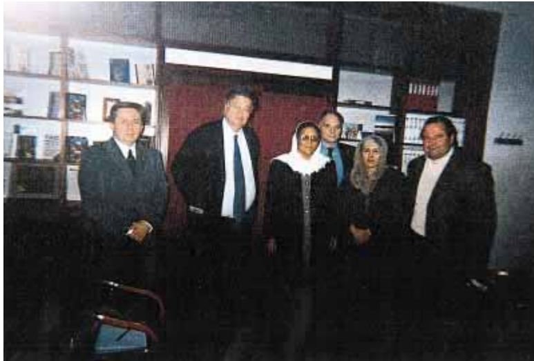
Rencontre avec Mme Habiba Sorabi, ministre Afghane de la condition féminine

A Ghazni, où Georges Frêche s'est rendu avec une partie de la délégation, les membres de la mission ont pu rencontrer le Gouverneur et le Vice-Gouverneur, la di-