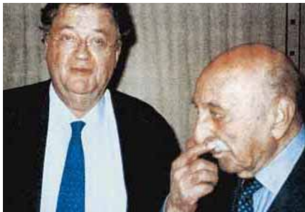
Georges Frêche avec le roi Zaher Shah

Dans le même esprit, un envoi de camions de collecte des ordures ménagères est envisagé, le mode d'acheminement étant le même que celui utilisé pour les bus.