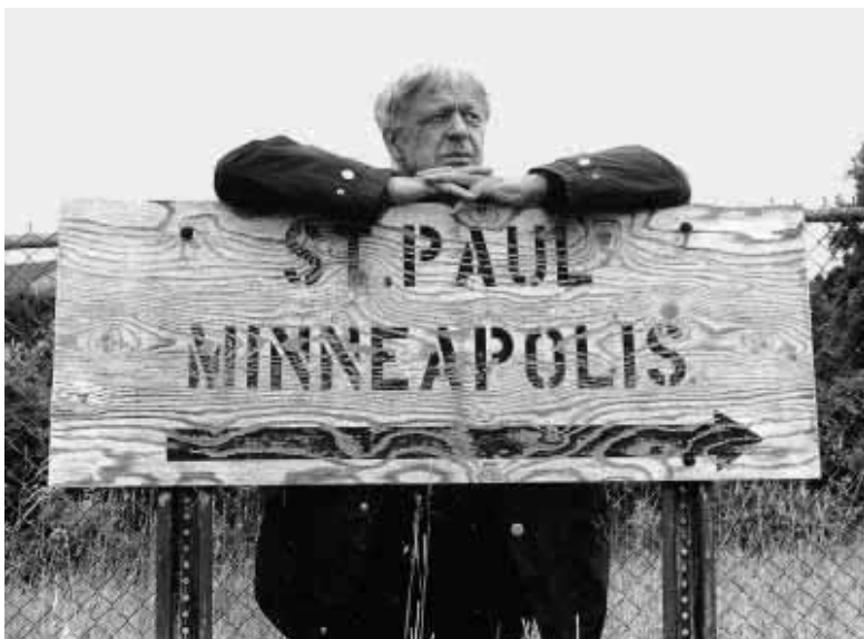
Michel Portal

Les unités fonctionnelles de ce nouveau service étaient auparavant éparpillées à Saint-Charles, à l'Institut de biologie, à l'hôpital Lapeyronie et à l'hôpital St Eloi. Le CHU de Montpellier a regroupé, dans un souci d'efficacité et de complémentarité, les unités de ce nouveau service dans des locaux de l'hôpital Lapeyronie. Ces 6 nouvelles unités fonctionnelles ont pour rôle l'évaluation de l'efficacité, de la tolérance clinique et de la dangerosité ou de la toxicité des médicaments, ainsi que l'identification de substances non médicamenteuses auxquelles l'organisme peut être confronté.