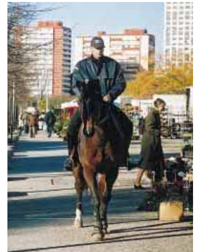
La nouvelle brigade équestre de la Mosson contrairement à celles destinées aux parcs et espaces verts du Domaine de Grammont, du zoo et de Montmaur, intègre des missions de police en zone urbanisée (marché, stade, domaine de la Mosson...).

Voitures, motos et scooters puissants, armement, tenue fonctionnelle, postes de police modernisés... : la police municipale est désormais équipée à la mesure des nouvelles missions qui lui sont confiées.