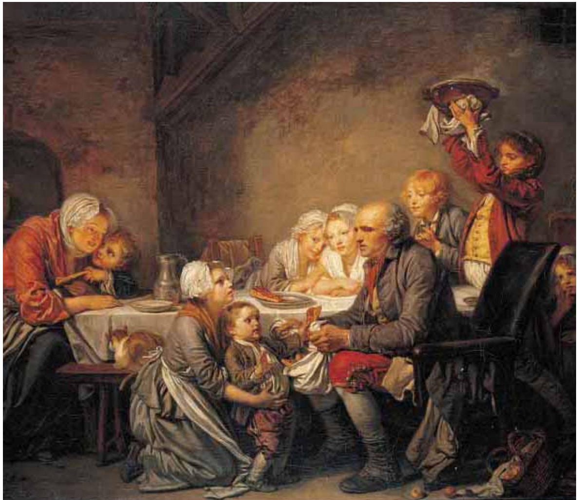
Le gâteau des Rois - Huile sur toile - 72 x 91 cm Legs Valedau, 1836 Inv.836.4.27

de la peinture hollandaise, l'art de Teniers ou Van Ostade, et les scènes d'auberge auxquelles Greuze a été sensible dès les années 1750. Ce n'est donc pas par hasard si Le gâteau des rois a été donné au musée Fabre par Valedau, grand collectionneur de tableaux nordiques. Par delà le sentimentalisme facile de ces visages d'enfants émus et sensibles qui ont fait la gloire de l'artiste, Greuze a insisté sur le contraste des générations tout en créant un type moral et social. Dans ce théâtre du quotidien, le réalisme individuel jouxte l'uniformisation des types coulés dans une psychologie traditionnelle des vertus familiales. Ce tableau, comme l'ensemble des collections du musée a été mis en caisse et est précieusement conservé pendant la durée des transformations du musée