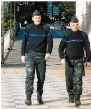
Les équipes des 91 policiers municipaux se relaient dans toute la ville du lundi au samedi de 7h à 13h30, de 13h à 21h et de 16h à 24h, en plus du dimanche pour les "puces" de la Mosson de 5h à 14h.