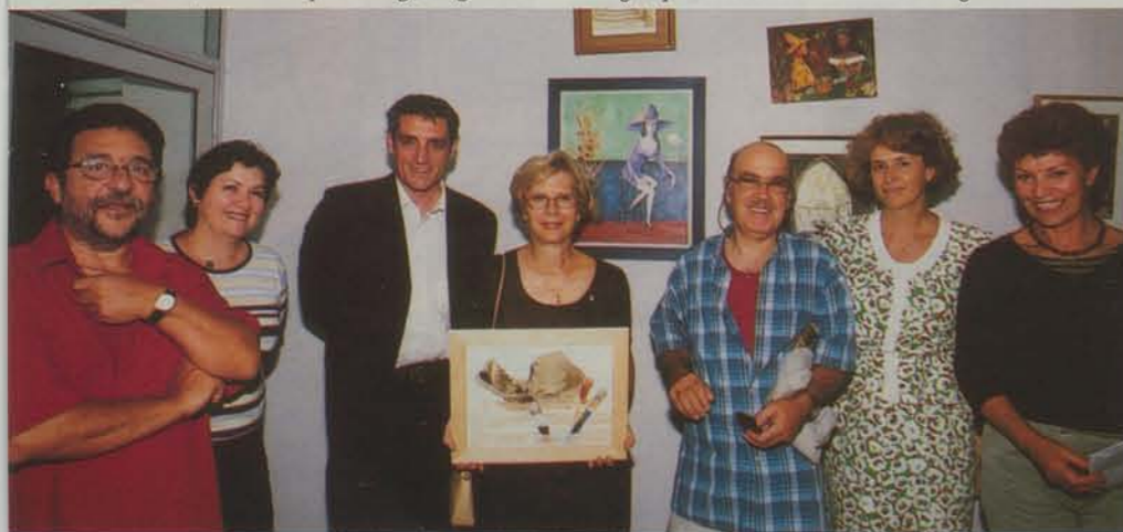
24 juin - Remise des prix du 9 ème concours de peinture de l'Age d'Or au CCAS