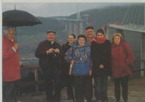
6 mars 2004 - L'Age d'Or fait le pont, au Viaduc de Millau.