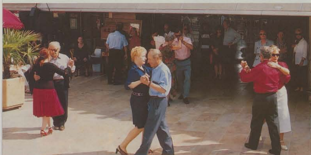
22-28 mai - En préambule au 3 ème Festival international de tango argentin, Montpellier Tango Sud (29-31 mai 2004), plusieurs journées de démonstrations et de bals étaient organisées à Montpellier, comme ici, lors de l'apéro tango, organisé au Triangle, par l'association Senior Tango.