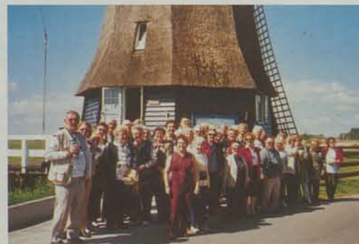
11-7 mai : Au pays des tulipes et des moulins à vents : l'Age d'Or en voyage en Hollande