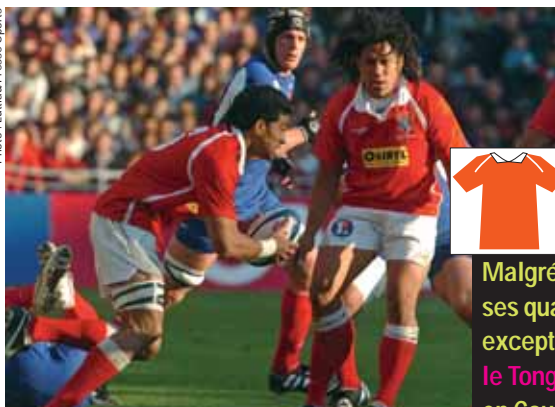
Les Tonga veulent marquer le tournoi.