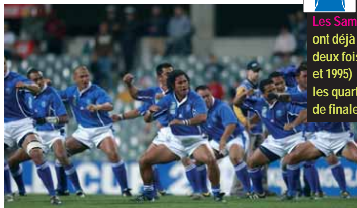
Les Samoa sont prêts à défier les Tonga.