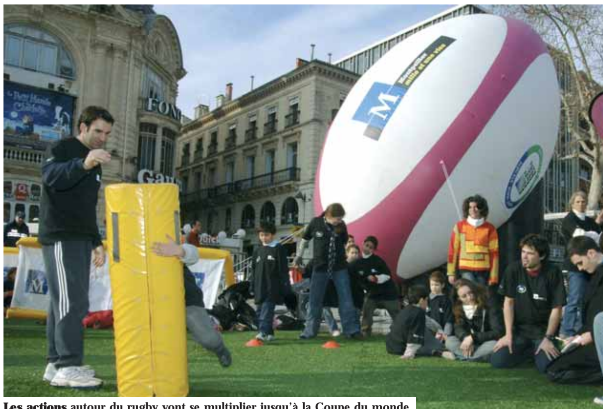
Les actions autour du rugby vont se multiplier jusqu'à la Coupe du monde.

La Coupe du monde s'annonce comme la fête de tous les Montpelliérains.