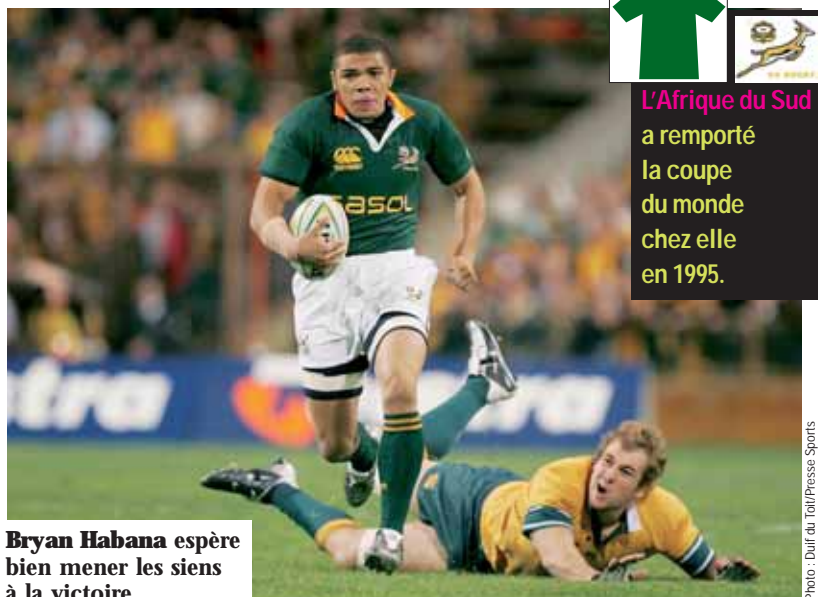
Bryan Habana espère bien mener les siens à la victoire.

C'est l'une des images fortes de la Coupe du monde : François Pienaar, le capitaine des Springboks, recevant des mains de Nelson Mandela, premier président noir du pays, le trophée William Webb Ellis. Plus qu'une consécration sportive, le premier couronnement mondial de l'Afrique du Sud en 1995 symbolise la réconciliation d'une nation déchirée par l'apartheid jusqu'au début des années 1990 et exclue de ce fait des deux premières éditions de la Coupe du monde. Au creux de la vague en 2003, après une défaite en quart de finale contre la Nouvelle-Zélande (9-29), le rugby sud-africain est