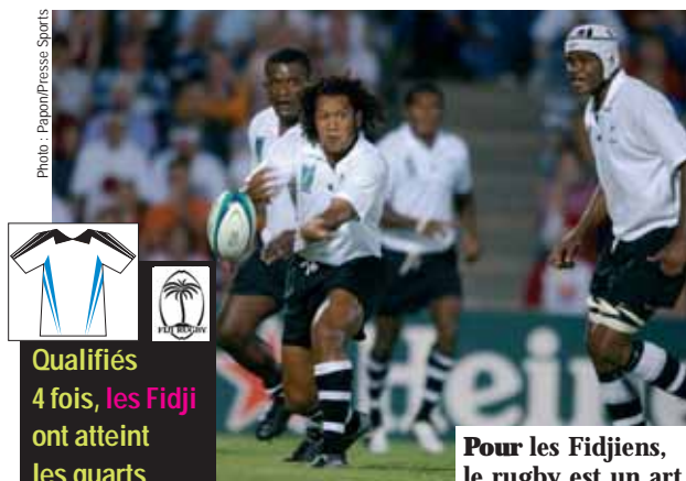
Pour les Fidjiens, le rugby est un art.

Les talentueux Fidjiens aiment faire le spectacle et ce, même si leurs résultats en Coupe du monde en pâtissent. Ils sont les rois du rugby à 7, mais à 15, leur manque de rigueur les pénalise. Imprévisibles comme leurs crochets dévastateurs, les Fidjiens ont illuminé la première Coupe du monde en ne s'inclinant qu'en quart de finale après avoir malmené la France. Depuis, les