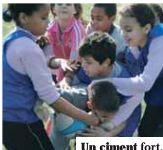
Un ciment fort.

gage au quotidien pour les défendre, notamment auprès des plus jeunes. Les grandes vertus d'ovale sont un ciment fort. « J'ai une réelle admiration pour la fraternité sur