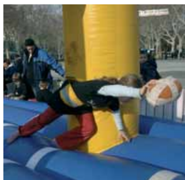
Plongée dans l'ovalie !

A ccompagner les enfants vers la découverte du sport, de la citoyenneté, du respect de l'autre et de sa culture, c'est la mission quotidienne des maisons pour tous de la Ville. Alors, lorsqu'il s'agit de participer activement à la préparation d'un événement planétaire comme la Coupe du monde de rugby, tout le monde est là. Les 26 maisons pour tous ont réussi à organiser une bonne dizaine d'expositions sur l'histoire des six nations qui joueront à Montpellier et leur relation au ballon ovale. Elles participent activement à chacune des opérations "Ovalie des quartiers", en partenariat avec le service des sports et le Montpellier Hérault Rugby Club : au fil des semaines, les enfants des centres de loisirs peuvent ainsi pratiquer des activités ludiques et rugbystiques sur le terrain synthétique installé au cœur de leur quartier. Début mars, un tournoi de rugby virtuel sur ordinateur a rassemblé de nombreux adolescents passionnés dans les maisons pour tous Jean-Pierre-