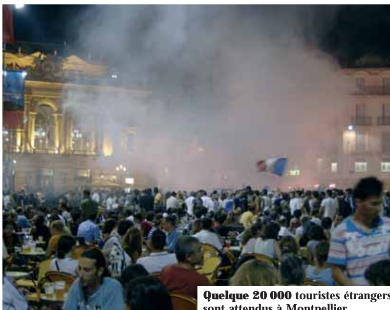
Quelque 20 000 touristes étrangers sont attendus à Montpellier.