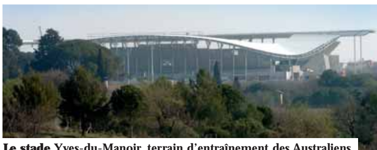
Le stade Yves-du-Manoir, terrain d'entraînement des Australiens.

Ce sera l'un des plus beaux complexes rugbyistiques de France. Le 23 juin prochain, le stade Yves-du-Manoir ouvrira à Montpellier. Réalisé par l'Agglomération avec le concours de la Région, de la Ville, du Département et de l'Etat, il permettra à l'équipe d'Australie de disposer de toutes les installations nécessaires à son entraînement. Et si les matchs