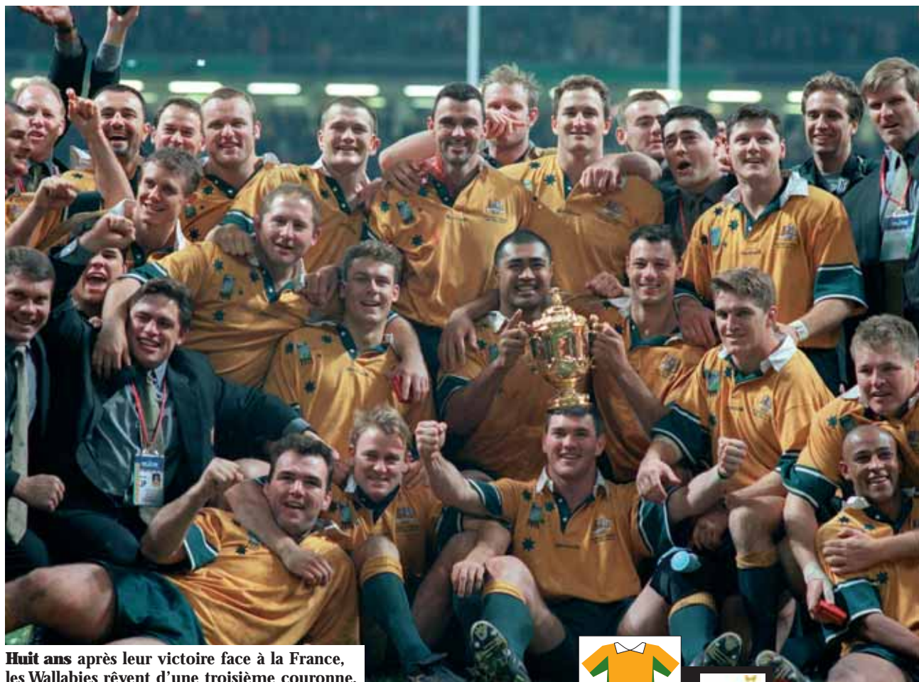
Huit ans après leur victoire face à la France, les Wallabies rêvent d'une troisième couronne.

L' Australie, c'est tout simplement le must du rugby. Avec deux titres de champions du monde, décrochés en 1991 à Twickenham face à l'Angleterre (12-6) et devant la France en 1999 (35-12), l'équipe australienne est aujourd'hui la formation la plus titrée au niveau