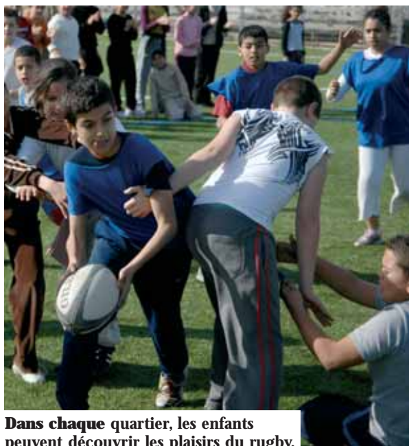
Dans chaque quartier, les enfants peuvent découvrir les plaisirs du rugby.

permet aux enfants et à leurs parents de s'initier au rugby auprès des éducateurs sportifs de la Ville et du club. Les visiteurs peuvent disputer sur ce terrain des matchs de Rugby Scratch , pratique dérivée du rugby où le plaquage est symbolisé par l'arrachée d'un fanion. A quelques mètres de là, deux ateliers, le Tir elastic et l' Equalizer permettent aux plus jeunes de marquer des essais en plon-