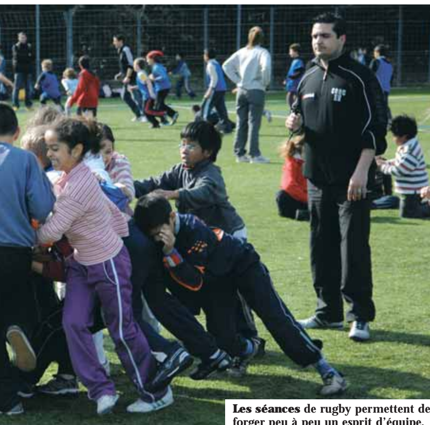
Les séances de rugby permettent de forger peu à peu un esprit d'équipe.