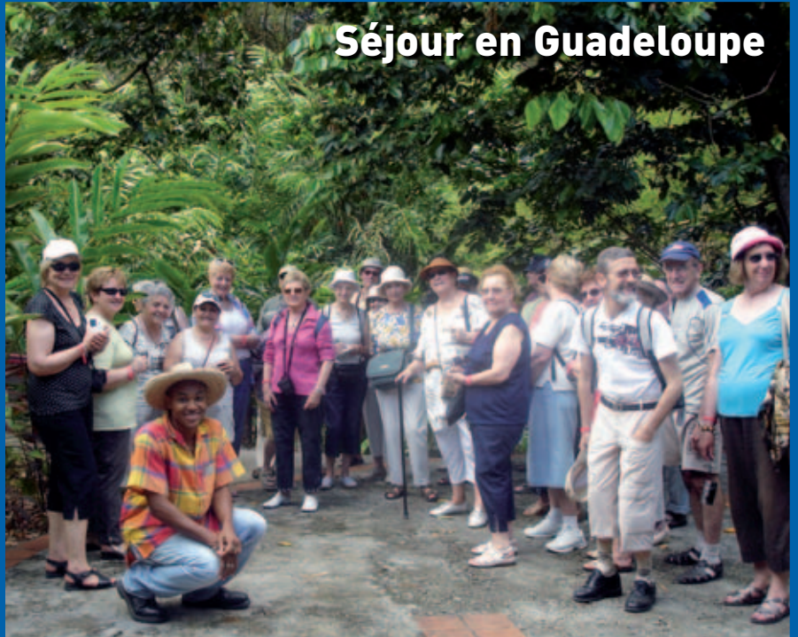
Séjour en Guadeloupe