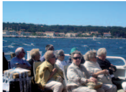
Abordage sur l'île des Embiez en juin

25 novembre : aquarium Mare Nostrum à Montpellier