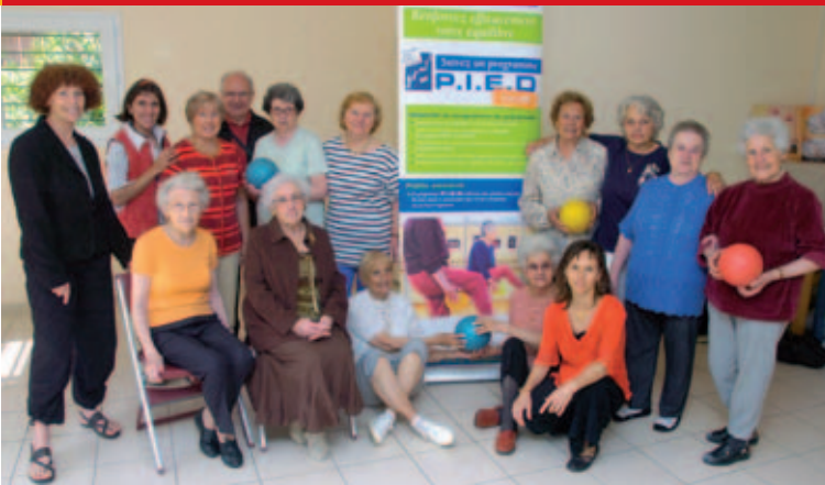
Bon pied, bon œil ! A l'issue du programme de gymnastique adaptée de prévention des chutes mis en place par Oxygène, un diplôme a été remis aux participants.