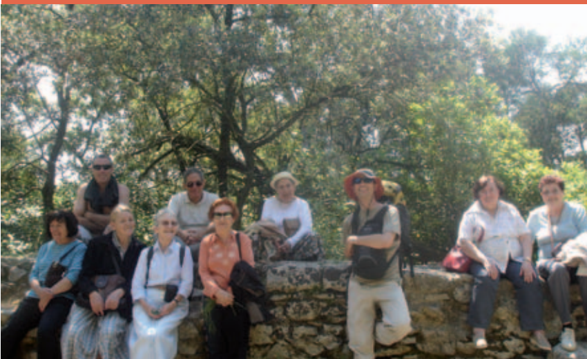
Sortie à Castries commentée par l'association Cap Environnement et visite du domaine départemental de Fondespierre.