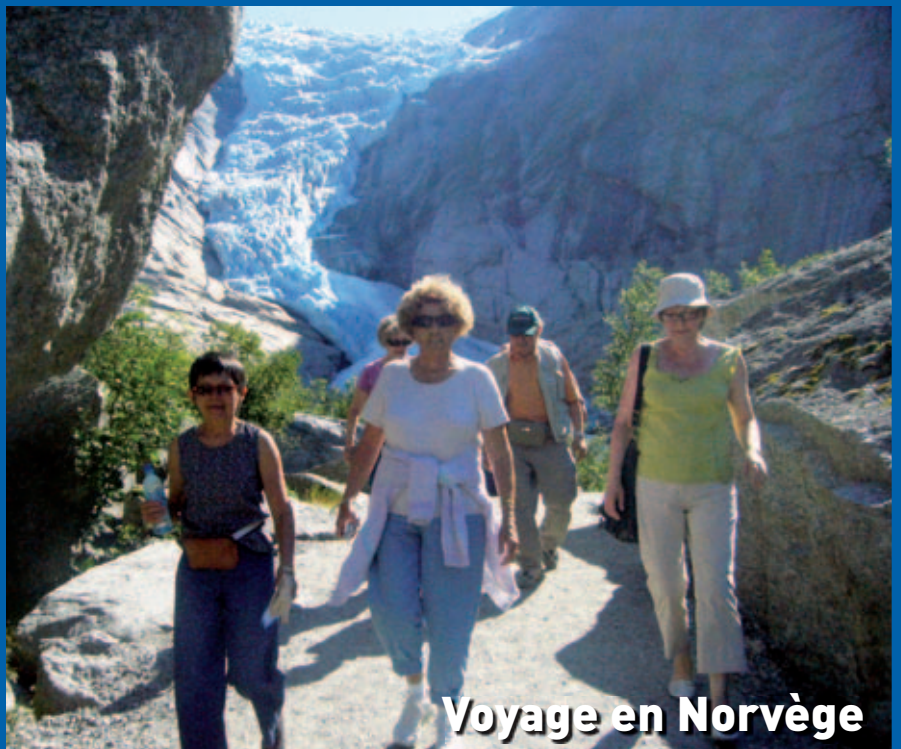
Voyage en Norvège