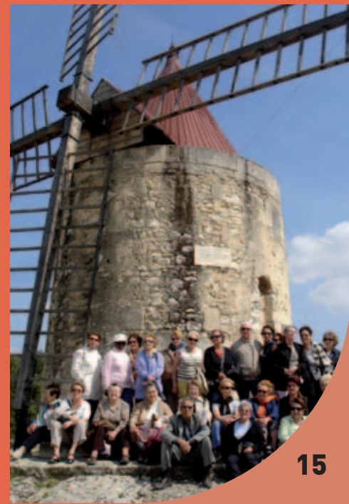
Au pied du moulin de Daudet lors d'une excursion aux Baux-de-Provence.