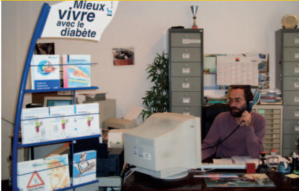
Une enquête menée en collaboration avec l'association des diabétiques de l'Hérault (11, rue de la Méditerranée. Tél : 04 67 65 51 26)