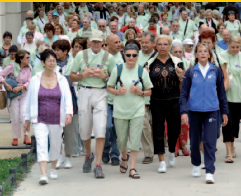
Pratiquiez la marche active !