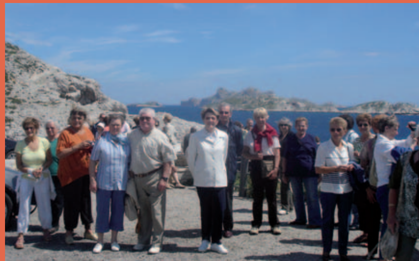
Une journée à Marseille, avec escale à l'archipel du Frioul.