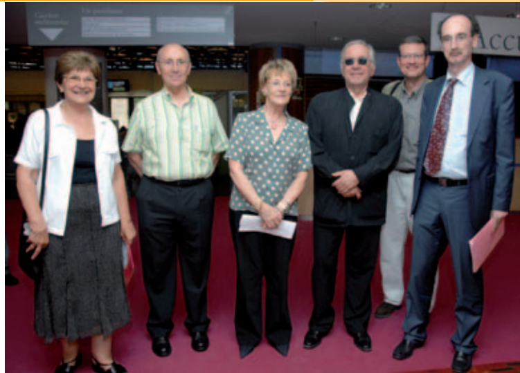
Lors de la remise du trophée