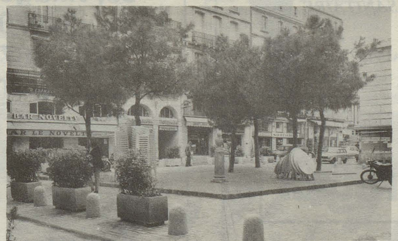
La place St-Ravy, un souffle d'air

• 13 logements réhabilités et 6 immeubles ayant fait l'objet de travaux sur les parties communes (façades, cages d'escaliers, toitures...) Pour les chantiers subventionnés le montant des travaux est de 627 000 Frs. Depuis cette date :