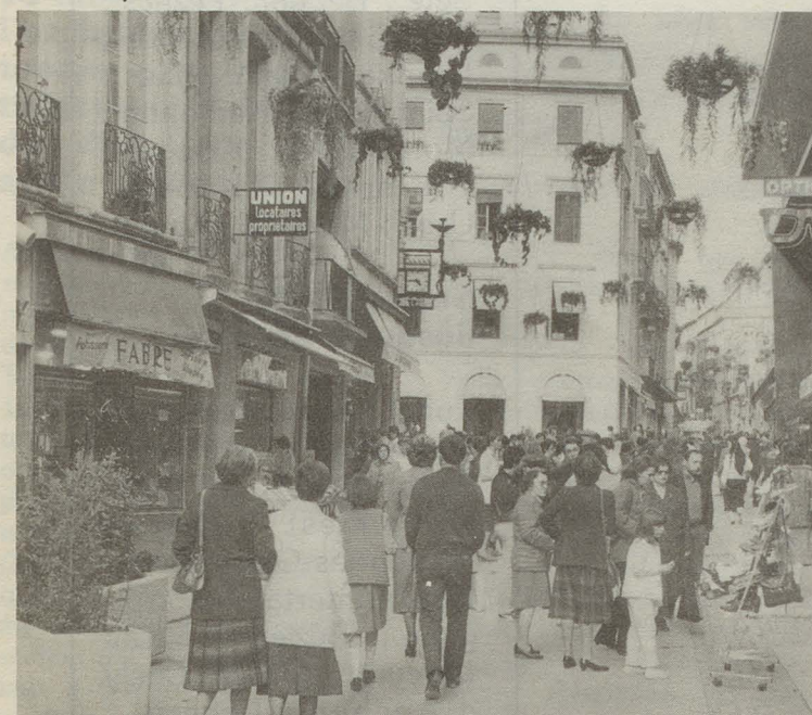
La grand rue rendue aux piétons