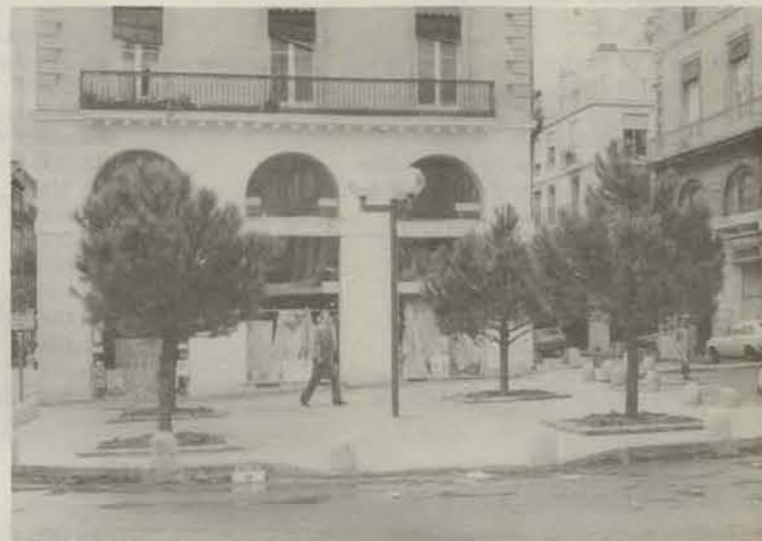
La place Edouard Adam au sommet de la rue de la Saunerle est rendue aux piétons. L'inauguration a eu lieu samedi 16 mai.