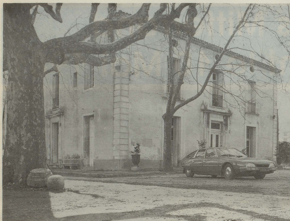
Un chantier de 500.000 F inscrit au budget 81

La démolition des bâtiments vétustes est aujourd'hui terminée. Les travaux ont commencé. L'ex-couvent des Sœurs Grises va bientôt abriter les nouveaux locaux du Conservatoire de Région.