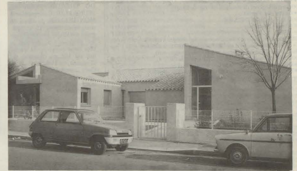
Des couleurs traditionnelles pastelées sur un terrain récemment planté au bord d'une rue passante.

Le Club du 3 e âge de la rue de la Cavalerie st maintenant bien rôdé. Cette magnifique construction décidée par le Centre Municipal d'Action Social sur un terrain de 234 m 2 comporte une grande salle, une salle à manger, une cuisine, une salle pour la distribution des repas, des locaux administratifs. Le coût élevé de cette réalisation (plus de 750.000 F) est amplement justifié aujourd'hui par le plaisir que trouvent quelques 200 personnes âgées à se retrouver là pour y jouer aux cartes, regarder la télévision, tout simplement trouver quelqu'un de leur quartier — ou l'oreille attentive de la permanente — à qui parler. Tous les jours un goûter est servi l'après-midi facilitant encore une certaine convivialité. Début juin certaines de ces personnes feront en car un voyage en Espagne où à la Salvetat. A ce jour toutes les places sont déjà retenues. La Cavalerie est vraiment devenue LEUR CLUB.