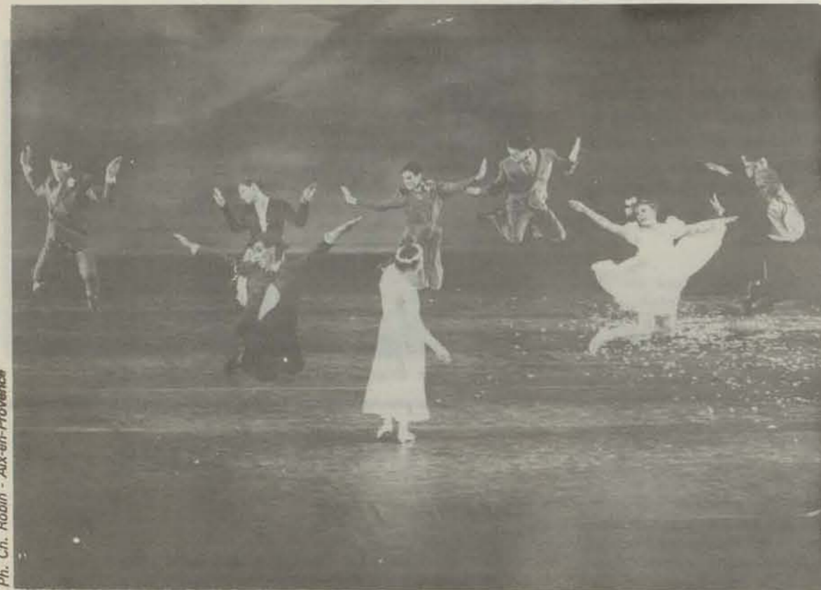
La Compagnie Dominique Bagouet concrétise l'effort de la ville pour la reconnaissance d'une chorégraphie moderne de qualité.