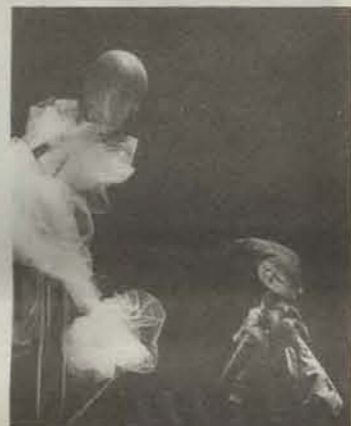
La compagnie de l'Echelle