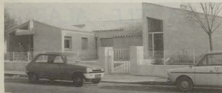
Le nouveau club du 3e âge de la rue de la Cavalerie

Le graphique se passe de commentaires. Mais il est juste, semble-t-il, d'expliquer la nécessité des sommes allouées. Depuis Novembre 1977, voici la liste des réalisations du BUREAU D'AIDE SOCIALE de MONTPELLIER : — Mise en service du car itinérant « Lou Clapas » — Ouverture de 4 clubs du Troisième Age et réfection de plusieurs autres — Remboursement de l'abonnement téléphonique — Mise en place de la Télé Alarme — Voyages-vacances du Troisième Age — Voyage annuel du souvenir (en Algérie) — Ouverture de 2 centres de soins — Création d'un service d'aides ménagères — Inauguration du foyer pour femmes en détresse — Construction de la résidence-foyer « Bel Juel » C'était un programme ambitieux mais qui a été mené à bien ; comme le seront, nous l'espérons, les projets pour 1981 et 1982.