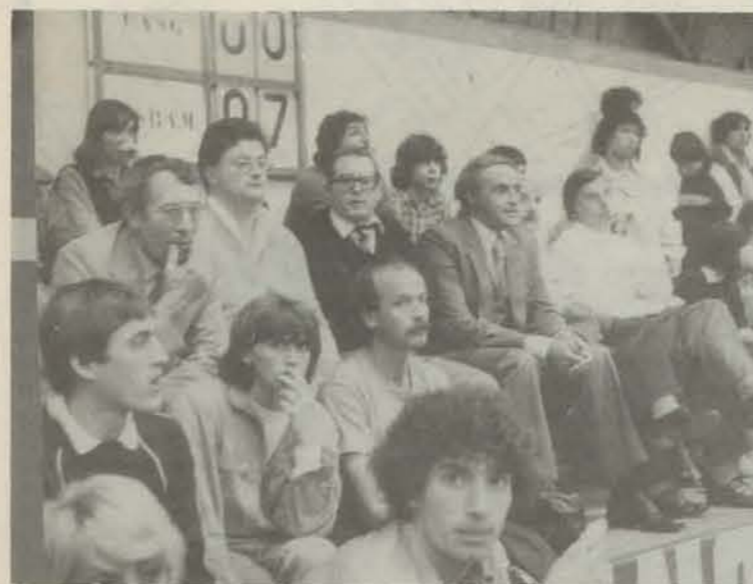
Le jour de la victoire décisive, l'inquiétude sur les visages de ceux qui attendent.

En battant en cinq sets le G.A.S.C. de Paris, l'A.S.B.A.M. a trouvé la récompense il y a un mois, de cinq ans d'efforts entre-coupés de victoires acquises haut la main (contre le Racing) comme de creux spectaculaires. Aujourd'hui c'est fait, ces amateurs courageux vont désormais être dans l'obligation d'organiser encore plus rationnellement leur entraînement. Avec beaucoup de volonté et de désinté-