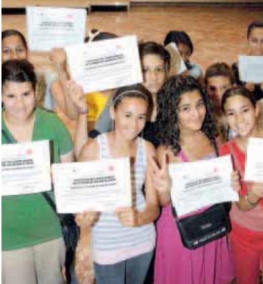
23 collégiens des Escholliers-de-la-Mosson ont reçu leur diplôme, à l'issue de la formation de prévention sécurité civique dispensée par la Croix Rouge.