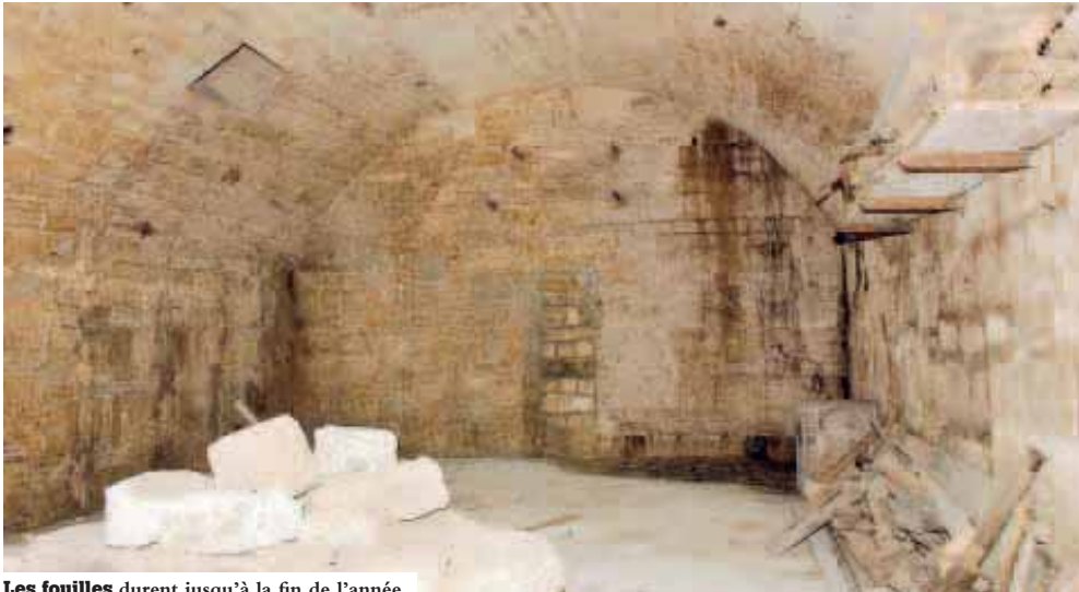
Les fouilles durent jusqu'à la fin de l'année.

Le patrimoine, cela se découvre. C'est en raison de fouilles archéologiques que le mikvé est fermé au public cette année. Mais exceptionnellement, il ouvre lors des Journées du Patrimoine. Depuis le mois de janvier, l'équipe du Lamm (Laboratoire d'archéologie médiévale méditerranéenne) s'emploie à révéler le passé de cet ensemble synagogal médiéval. Le mikvé, bain rituel juif, date du XII e siècle. Situé au 1 rue de la Barralerie, c'est la seule trace solide de l'existence d'une communauté juive au Moyen-Âge à Montpellier.