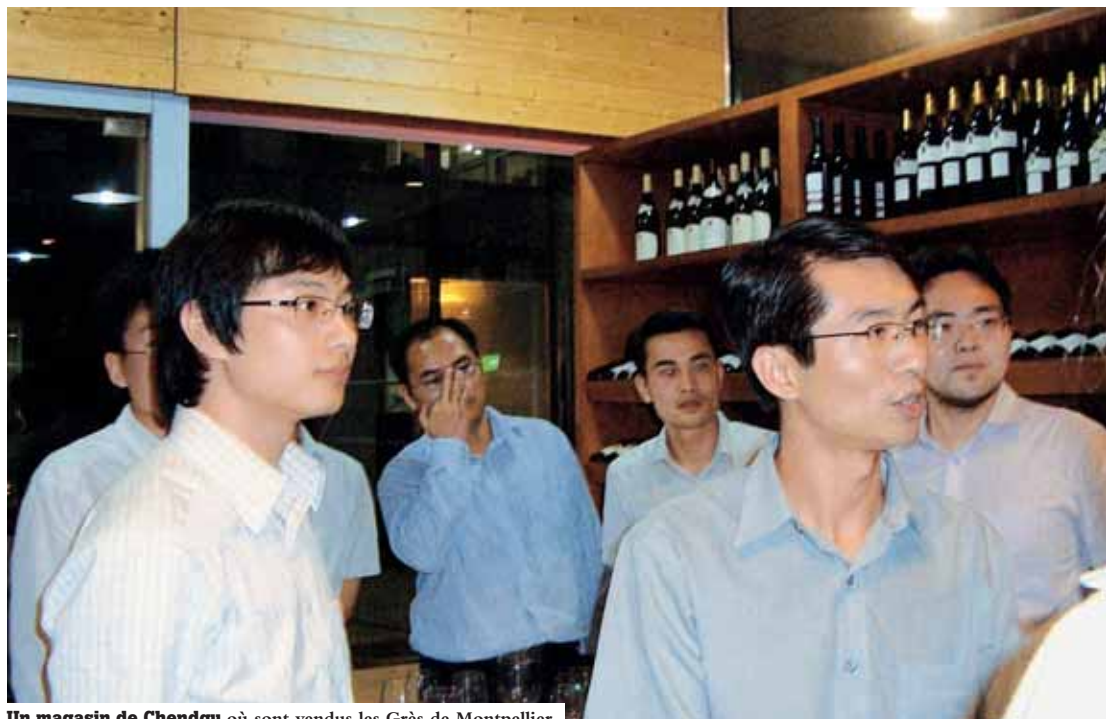
Un magasin de Chengdu où sont vendus les Grès de Montpellier.

Les vignobles sont localisés sur une bande côtière de 20 km de large, s'étendant de Lunel à Mèze. En été, ils sont exposés aux brises