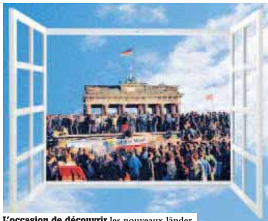
L'occasion de découvrir les nouveaux länder.

C et automne, le 9 novembre exactement, cela fera exactement 20 ans qu'une révolution pacifique a balayé le régime communiste de la RDA et fait tomber un mur qu'on pensait indestructible. Un mur qui a séparé un pays, une ville, mais aussi de nombreuses familles. La 7 e Semaine allemande, du 25 septembre au 4 octobre, commémore cet événement qui a marqué le début d'une reconstruction européenne et d'un nouvel ordre mondial. L'occasion d'entamer une réflexion