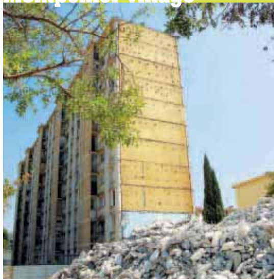
La déconstruction des entrées 1 et 2 du bâtiment A au Petit Bard est largement entamée. La pelle à grand bras, capable d'agir jusqu'à 56 m de hauteur, s'est montrée très efficace.

Alco - Petit Bard - Pergola Cévennes - Saint-Clément La Chamberte - La Martelle Montpellier village