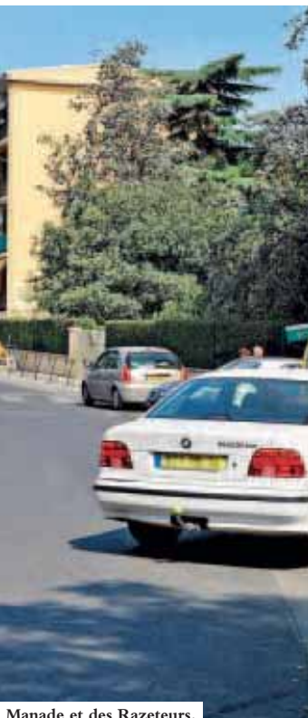
Manade et des Razeteurs.

enfouis. Enfin, le collecteur d'eaux pluviales sera renforcé afin de faire face aux problèmes de ruissellement qui affectent le quartier.