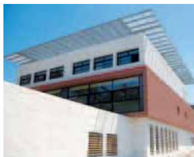
L'école élémentaire André-Malraux.

résidences riveraines était important. Au lycée professionnel Pierre-Mendes-France, situé rue du Mas-de-Brousse, près d'Odysseum, 1550 élèves, ont investi les 8000 m 2 , répartis en 7 bâtiments. La Ville a cédé pour un euro symbolique à la Région, un terrain de 4 hectares pour sa construction. Elle a pris pour sa part, la création des voies de desserte du lycée et a édifié le gymnase Françoise-Spinosi. Cette structure sportive de 2000 m 2 , sur 2 niveaux fait face au lycée.