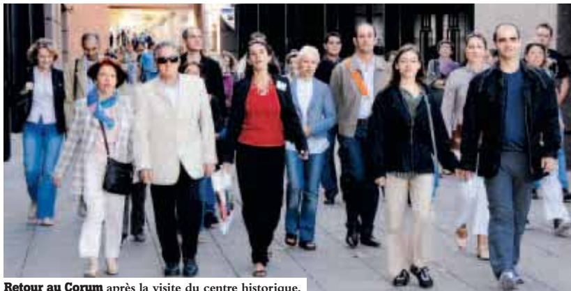
Retour au Corum après la visite du centre historique.

S amedi 26 septembre, la Ville accueille ses nouveaux habitants. La 8 e ville de France compte 10,3 nouveaux Montpelliérains chaque jour. Pour que tous les arrivants trouvent leur place dans la cité, les élus municipaux leur présentent leur nouvelle commune. Cette journée s'adresse aux résidents arrivés depuis moins d'un an à Montpellier. Ils pourront ainsi découvrir l'histoire de la ville, son organisation ainsi que l'équipe municipale. La journée débute à 8h30 dans le hall de l'Hôtel de Ville, par un petit déjeuner, puis, par un exposé des grands projets d'urbanisme. Elle est suivie par une