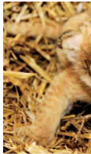
Un lionceau de l'Atlas est né le 1 er juillet.