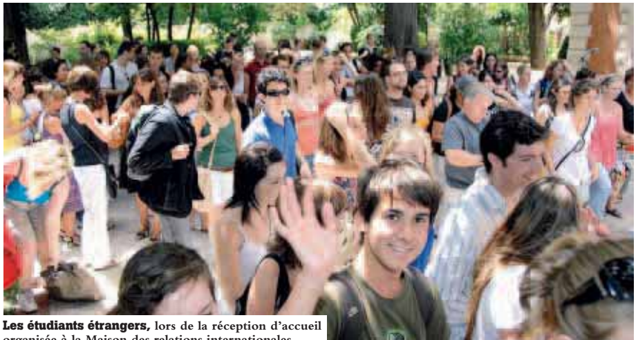
Les étudiants étrangers, lors de la réception d'accueil organisée à la Maison des relations internationales.

15000 stagiaires, de 60 nationalités différentes, y séjournent chaque année, de 15 jours à un an. Montpellier a du succès. Cela tient autant à sa renommée universitaire, qu'à sa situation géographique privilégiée et son dynamisme culturel. On y vient sachant qu'on va joindre l'utile à l'agréable. Cet été, 3000 étudiants en langue FLE ont étudié au Clapas. Des collégiens, lycéens, étudiants, mais aussi des salariés et retraités. Certains étaient débutants, d'autres confirmés. Tous sont repartis avec des acquis confortés. Le bouche à oreille va continuer à faire son office... Il n'y a pas en effet de meilleur ambassadeur qu'un touriste satisfait. Mais c'est vrai que les formules d'enseignement sont adaptées aux attentes. Elles sont couplées à