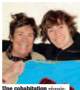
Une cohabitation réussie.

« N ous avons tous beaucoup à gagner ! », telle est la devise de Concorda Logis qui développe un concept novateur pour se loger. Cette association de rapprochement intergénérationnel propose aux étudiants un hébergement peu onéreux et convivial chez des seniors. Cette solution s'adresse aux étudiants, jeunes actifs, apprentis... Pour moins de 200 euros par mois, ils disposent de leur propre chambre, de l'accès à la cuisine et aux sanitaires. En échange, les jeunes logés par-