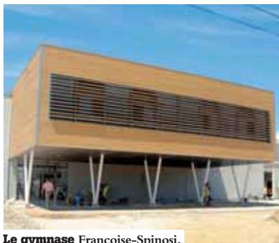
Le gymnase François-Spinozi.

Elle est complétée par un terrain d'athlétisme et un plateau d'éducation physique. La salle de sport, homologuée pour les compétitions départementales (hand, basket, volley, badminton, danse) dispose de gradins pour le public. Elle comprend également une salle d'expression libre, équipée pour la pratique des sports de combat. Le gymnase est réservé au lycée, pendant le temps scolaire. En dehors de celui-ci, des créneaux horaires sont attribués aux clubs et associations du quartier.