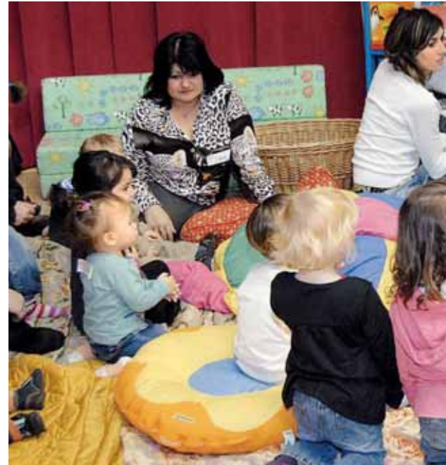
Les relais sont des lieux conviviaux où enfants et nounous se retrouvent ré

Un autre projet, entrepris avec la CAF et le Conseil général, réside dans l'ouver-