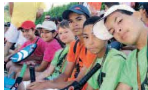
Douze jeunes ont participé à la rencontre nationale

A u tennis club des Garrigues, le site a été labellisé en juin 2008, "Fête le mur". Dans le cadre de la convention signée avec l'association parrainée par Yannick Noah, la maison pour tous Georges-Brassens propose toute l'année des leçons et des stages gratuits de tennis. « Pour cette saison, 120 enfants ont suivi les cours et 250 jeunes ont participé à des activités sur le site, annonce fièrement Delphine, en charge de l'animation. C'est une très belle performance. Entre les interventions dans les écoles dans le cadre de la réussite éducative et notre implication dans le quartier via la maison pour tous, beaucoup d'enfants ont découvert le sport roi de Roland-Garros ». Mais le but de Yannick Noah en créant ces sites est d'ajouter une dimension sociale à l'activité sportive. Les jeunes Montpelliérains ont assisté à l'Open 13 à Marseille, puis récemment à la rencontre nationale de "Fête le mur" à Aix-en-Provence. « 12 adolescents s'y sont rendus, choisis pour