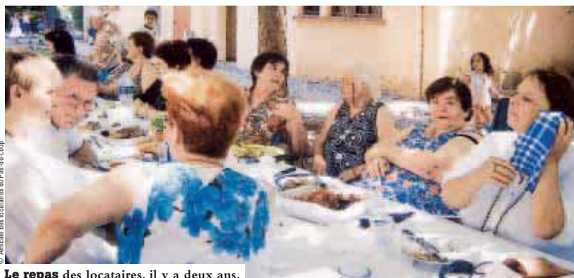
Le repas des locataires, il y a deux ans.