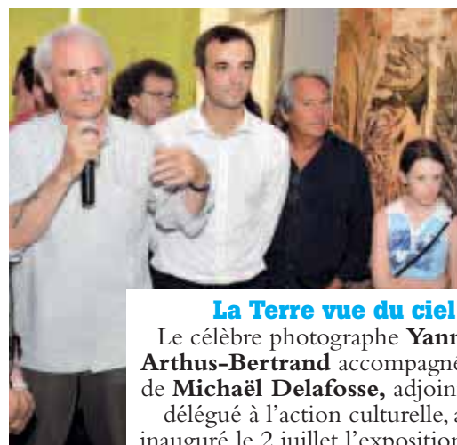
La Terre vue du ciel. Le célèbre photographe Yann Arthus-Bertrand accompagné de Michaël Delafosse, adjoint délégué à l'action culturelle, a inauguré le 2 juillet l'exposition La terre vue du ciel , présentée jusqu'au 11 octobre au Pavillon Populaire et sur l'Esplanade.