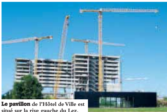
Le pavillon de l'Hôtel de Ville est situé sur la rive gauche du Lez.

Le pavillon de l'Hôtel de Ville est un espace ouvert au public, dédié au projet de la future mairie de Montpellier. Il permet de découvrir le bâti-