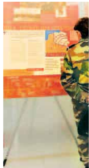
Un circuit chronologique et thématique.

Les supports audiovisuels et bornes interactives soulignent et approfondissent les sujets essentiels. Régulièrement, la présentation des collections est mise à jour,