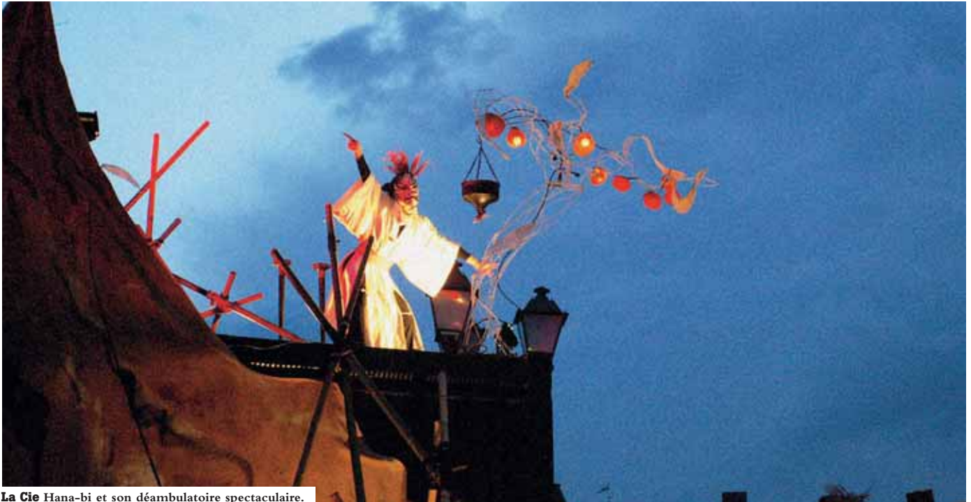
La Cie Hana-bi et son déambulateur spectaculaire.

Les arts de la rue et le théâtre sont à la fête pour ce troisième volet de Scènes publiques. Ce nouveau rendez-vous culturel, proposé par la Ville de Montpellier, a lieu tous les samedis, du 12 septembre au 10 octobre. Toutes les formes artistiques sont explorées, de la performance poétique de la Cie Les P'tites Marguerites, au déambulateur spectaculaire de la Cie Hana-bi et de la CIA, en passant par le cirque contemporain du Cirk'Oblique, les danseurs acrobates sur façades de la Cie Lézards bleus ou encore la bodega-théâtre de la Cie Art mixte. Trois spectacles sont également dédiés au jeune public : les acrobaties musicales la Cie Lilith, les contes animaliers de Pascale Rouquette et le conte acrobatique de la Cie Zébulon.