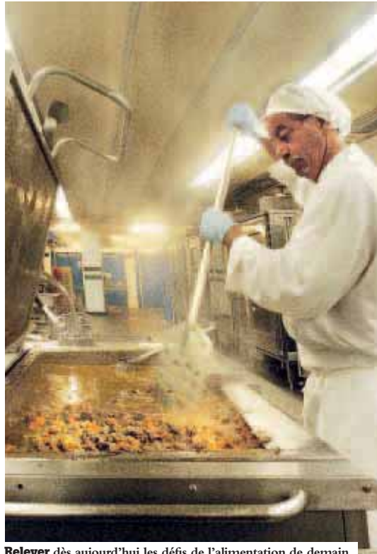
Relever dès aujourd'hui les défis de l'alimentation de demain.

Sélectionné, un produit répond à de nombreux critères : connaissance des ingrédients, absence d'OGM, traçabilité, apports nutritionnels, présence d'allergènes... Le critère "qualité", essentiel, représente 80% du choix. « Nous relevons dès aujourd'hui les défis de l'alimentation de demain en collectivité, déclare Hélène Mandroux, maire de Montpellier et 1 re vice-présidente de la Communauté d'agglomération, pour le bien-être des enfants. » Tous les ans, des travaux de construction ou de rénovation "collent" aux