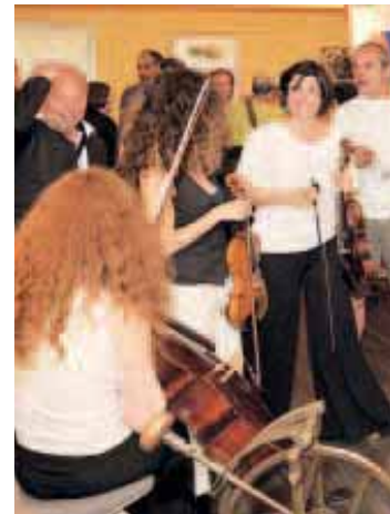
Un espace de 800 m 2 dédié à l'échange

contres. Premier objectif du Centre : accueillir des artistes pour des projets d'une durée de quelques jours à quelques semaines. « Le Centre culturel n'est pas un lieu de formation ni de diffusion, mais bien un espace de rencontres. » C'est une école de la diversité, du partage et du rapprochement des cultures par le biais de la création artistique. « L'association recrée ici ce qu'elle vit à l'étranger », poursuit Fred Tari. Lors de leurs tournées, les musiciens multiplient les rencontres avec les populations. « Au Mozambique dernièrement, nous avons joué dans les prisons, les écoles ou encore les hôpitaux, en privilégiant des temps d'échanges avec les publics. On fait ce que l'on appelle de "l'humanitaire culturel". Dans notre Centre, on essaie de profiter des artistes en