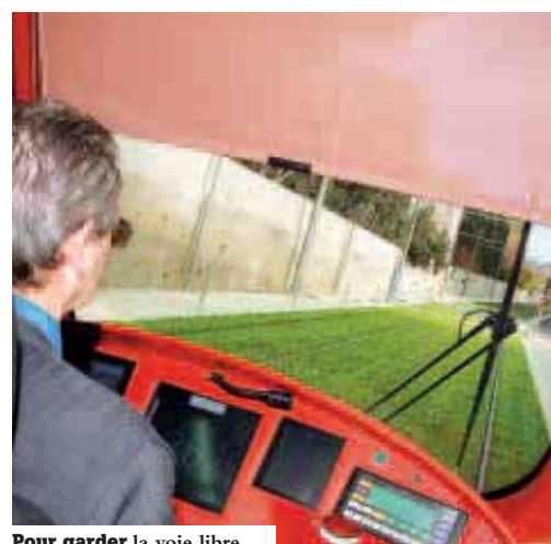
Pour garder la voie libre...

La rue de la Taillade est à sens unique dans le sens avenue de la Liberté vers l'avenue de Lodève (l'accès à la clinique Beausoleil est préservé). La rue Pierre Causse est de nouveau ouverte.