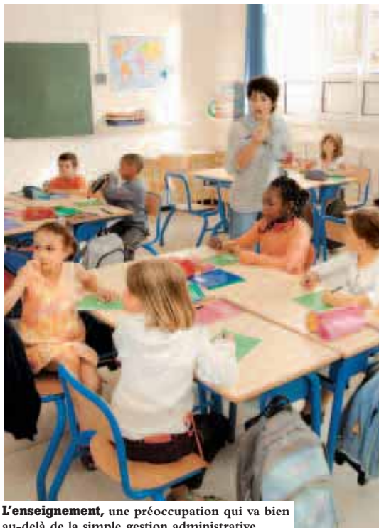
L'enseignement, une préoccupation qui va bien au-delà de la simple gestion administrative.

La charge va au-delà d'une simple gestion administrative et comptable de la vie scolaire. Le service éducation met en œuvre bien des activités : l'animation en milieu scolaire (classes de découverte, concerts pédagogiques...), l'accueil du temps périscolaire (études surveillées, accueil le matin et le soir), le suivi des centres de loisirs (centre municipal, centres de loisirs associatifs et de maison pour tous, basés dans les écoles), l'équipement informatique et les liaisons Internet, la prestation des agents municipaux (assistance éducative, nettoyage des locaux), l'ani-