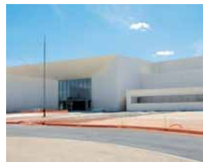
Le lycée Pierre-Mendes-France.