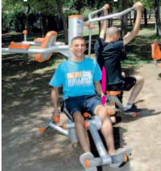
A Richter , une aire de jeu, destinée aux adultes, est installée à proximité de celle réservée aux enfants. Avec cinq modules pour faire de la musculation, du cardio-training et de la relaxation.

La Pompignane - Richter - Millénaire - Grammont - Jacques-Cœur - Odysseum