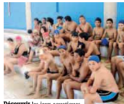
Découvrir les jeux aquatiques.

La première semaine, les journées étaient rythmées par des activités sportives au gymnase Marcel-Cerdan le matin (boxe, taekwondo, futsal, volley...) et piscine l'après-midi. A Marcel-Spilliaert, les éducateurs ont travaillé avec les maîtres nageurs pour initier les jeunes à divers jeux aquatiques. C'est ainsi qu'ils ont découvert le water polo, ont reçu des notions de sauvetage et certains même se sont perfectionnés en natation. La deuxième semaine, le groupe a effectué plusieurs sorties, notamment à la plage et