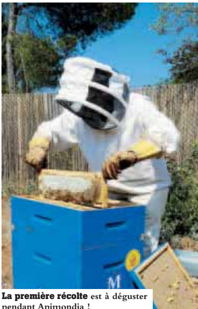
La première récolte est à déguster pendant Apimondia !

L e Mas Nouguier est un agriparc public de 18 hectares, reliant les ZAC Ovalie et des Grisettes, deux quartiers récents à forte dimension environnementale. Cette espace est planté de vignes avec lesquelles la Ville produit la cuvée du Mas Nouguier. Elle souhaite aussi développer l'apiculture. 15 ruches, colonisées chacune par quelque 80 000 abeilles, devraient permettre aux Montpelliérains de goûter au fruit de la première récolte. Le Mas Nouguier a une vocation biologique, mais aussi pédagogique et de loisirs. Il a été aménagé notamment à destination des enfants et des écoliers de la ville. Et devrait bientôt être complété par une "miellerie", où il sera possible de confectionner toutes sortes de produits dérivés du miel. Et, qu'on se le dise, les ruches se portent bien mieux au centre des agglomérations, qu'en pleine nature ! Et ce, en raison de l'absence de produits phytosanitaires et de la grande diversité des plantes à butiner.