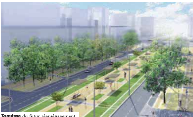
Esquisse du futur réaménagement.