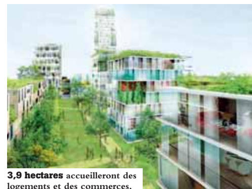
3,9 hectares accueilleront des logements et des commerces.

Une page se tourne. La délibération du 27 juillet lance l'opération Pagézy. La ZAC verra le jour aux alentours de 2015. La démolition de la mairie sera l'acte inaugural des travaux. Dans une petite dizaine d'années, l'îlot de l'actuelle mairie, ses parkings et leurs abords, ainsi que certains accès automobiles et cheminements piétons/cyclistes qui s'y rapportent, auront changé de visage. Dans ce nouveau quartier, environ 500 à 600 logements (dont une partie de logements sociaux) partageront ces 3,9 ha avec des commerces et éventuellement un hôtel. Cet ensemble sera accompagné d'espaces publics favorisant les liaisons urbaines entre les différents quartiers mal desservis actuellement. Un axe vert reliera le boulevard d'Antigone à la rue Frédéric-Mistral et à la place de la Comédie. Il favorisera les liaisons avec l'Esplanade du Champs-de-Mars.