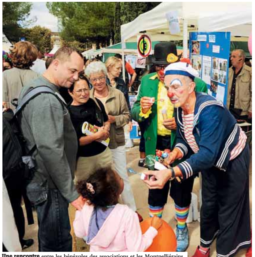
Une rencontre entre les bénévoles des associations et les Montpelliérains.

Quant à l'implantation des 1200 stands, elle change aussi, pour moins de densité sur