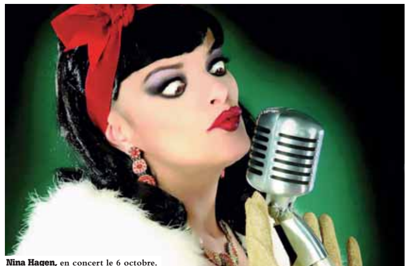
Nina Hagen, en concert le 6 octobre.

vialité, avec des repas, apéritifs, vide greniers musicaux, démonstrations d'instruments..., en parallèle des concerts donnés par les meilleurs guitaristes locaux et régionaux, de la génération montante. Il y aura Les 24 heures démentes . Une nouveauté encore. Ce marathon du week-end des 10 et 11 octobre propose un parcours dans Montpellier, rythmé par les concerts et ponctué par des projections, des DJ's, des expositions