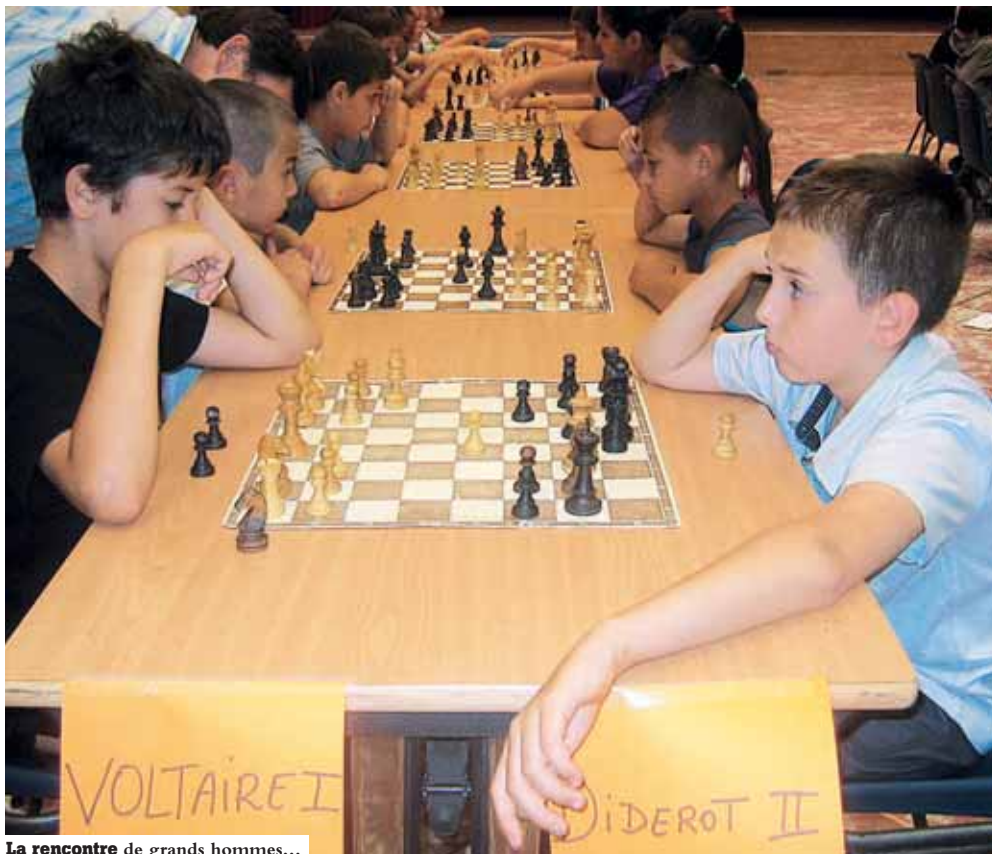
La rencontre de grands hommes...

E n coopération avec l'Inspection académique et la Direction régionale des affaires culturelles (Drac), la Ville met en place des activités artistiques et scientifiques, intégrées au temps scolaire. Un budget de 70 000 € finance, au sein des écoles, des prestations d'artistes, qui terminent souvent l'année scolaire par des expositions ou spectacles divers. Ainsi, la Cie Didier Théron et les enfants des écoles Heidelberg et Roosevelt ont présenté en juin dernier les travaux de fin d'ateliers de danse contemporaine.