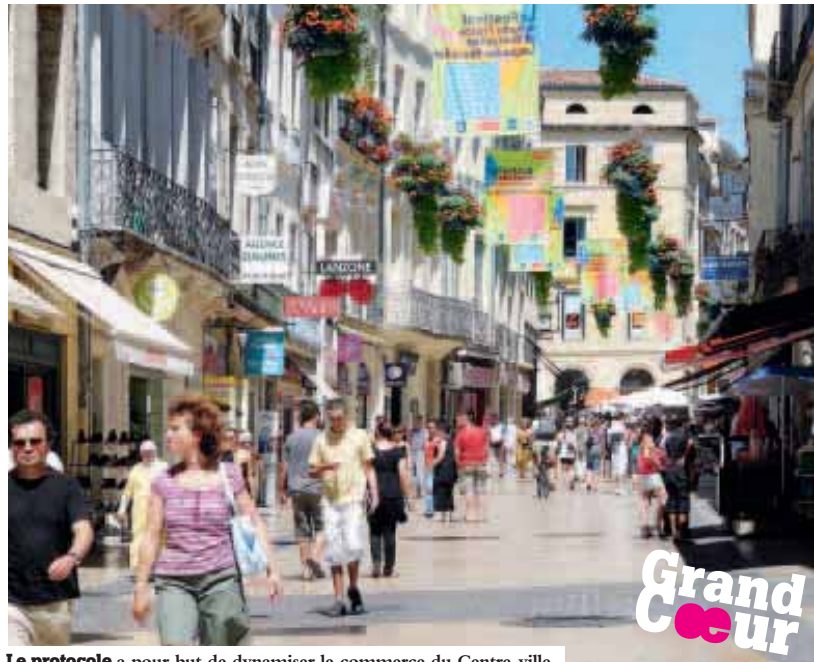
Le protocole a pour but de dynamiser le commerce du Centre-ville.

Le 6 e comité de pilotage du protocole d'accord signé entre la Ville, la CCI, la Socri (centre commercial du Polygone), la Serm, la Communauté d'Agglomération, la SCI Odysseum II, la Faduc et les Galeries Lafayette s'est tenu le 23 juin. Il rassemble des représentants de chacun des signataires, ainsi que ceux