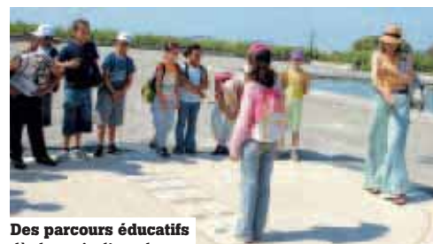
Des parcours éducatifs dès le mois d'octobre.

La Ville, en partenariat avec les services de la Préfecture, de l'Inspection académique et du conseil général de l'Hérault, souhaite réduire la rupture sociale et scolaire (loi de cohésion sociale de janvier 2005). Son projet court jusqu'à fin 2009. Dans le cadre de la plateforme de réussite éducative, des appuis sont proposés aux familles pour l'aide à la scolarité,