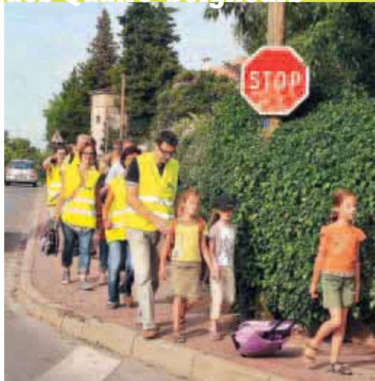
Un Pédibus expérimenté en juin, est désormais proposé par les parents d'élèves pour desservir le groupe scolaire Ferry-Téresa.

Aiguelongue - IUT Hauts-de-Saint-Priest - Malbosq - Vert-Bois - Plan des Quatre-Seigneurs