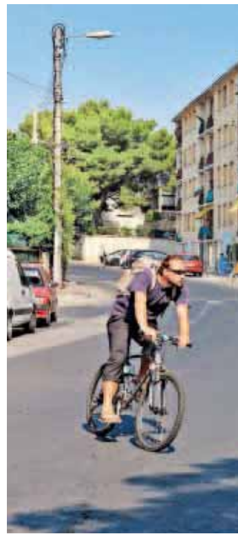
Le chantier sera situé entre les rues de la

ment souterrain. Le réseau d'eaux usées sera renouvelé et réhabilité tandis que celui d'eau potable sera dévié et rénové. Il comprend le remplacement de 40 branchements en plomb. Quant aux réseaux aériens (ERDF, France Télécom, éclairage public...) ils seront