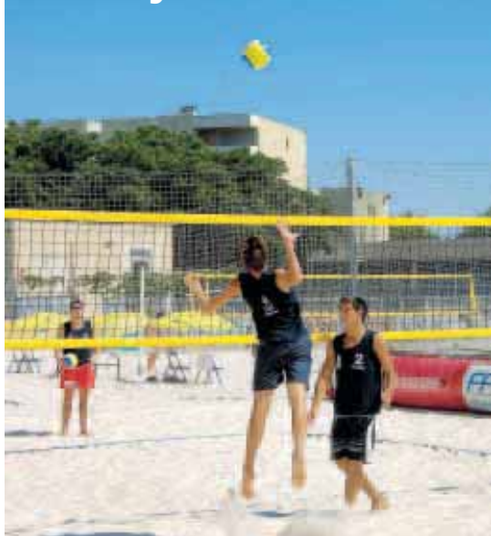
Le France Beach volley tour a fait escale à la Rauze les 10 et 11 juillet à l'occasion du Montpellier Beach masters.