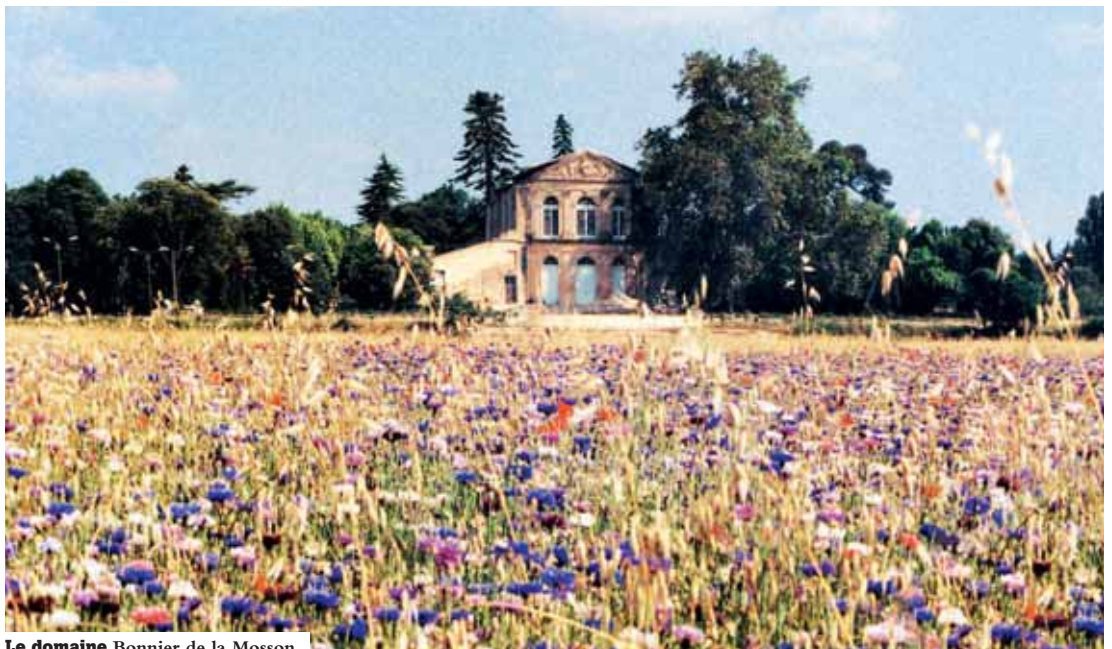
Le domaine Bonnier de la Mosson.