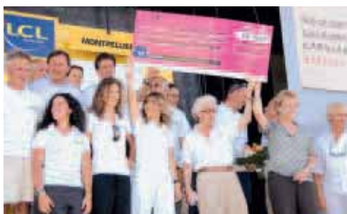
L'étape du cœur. En préambule du tour de France, la Ville a accueilli l'association Mécénat chirurgie cardiaque, qui œuvre pour récolter des fonds au profit d'enfants atteints de maladies cardiaques. Une subvention de 10 000 euros a été votée par le conseil municipal pour apporter son soutien à cette action portée par de nombreuses célébrités.