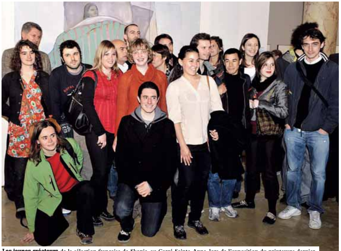
Les jeunes créateurs de la sélection française de Skopje, au Carré Sainte-Anne, lors de l'exposition du printemps dernier.

Ils sont 700 créateurs de moins de 30 ans, à exposer leurs œuvres à Skopje, capitale de la république de Macédoine, dans le cadre de la Biennale des jeunes créateurs d'Europe et de la Méditerranée (BJCEM). Ils ont été sélectionnés par des jurys de professionnels, pour participer à ce festival pluridisciplinaire dédié à la jeune création, organisé par l'association internationale pour la BJCEM. Une association constituée de 75 membres, issus de 21 pays différents. Skopje est située au cœur d'une région multiculturelle et multiethnique. La ville compte 500 000 habitants, dont 300 000 ont moins de 30 ans. Pendant les 10 jours de la manifestation, la capitale devient un haut lieu branché de rencontres d'artistes, pendant les dix jours de la manifestation, les