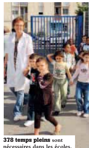
378 temps pleins sont nécessaires dans les écoles.