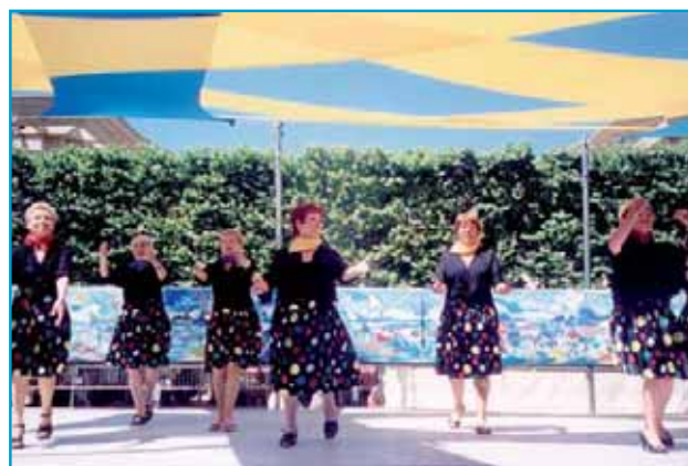
La danse et le chant sont au rendez-vous.

Le matin (à partir de 9h), les adhérents des clubs de l'Age d'Or vont s'affronter dans une joute amicale, devant un public nombreux : belote, tarot, Rumikub, scrabble, bridge, pétanque, etc. Une marche sera proposée sur les bords du Lez. Dans le cadre des rencontres intergénérationnelles, un jardin éphémère sera créé, place du Nombre d'Or. Des enfants et des adhérents des clubs réaliseront ensemble un espace floral, réunissant, rocaille, bassin, pelouse et plantes. Seront associés notamment les seniors qui participent toute l'année aux trois jardins partagés, créés sur la ville : à la Cavalerie, aux Aubes et à la Carriera.