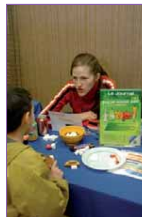
Des conseils pour bien manger...