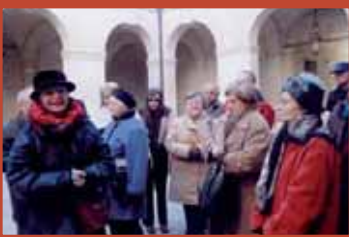
30 janvier. Sortie à Uzès.