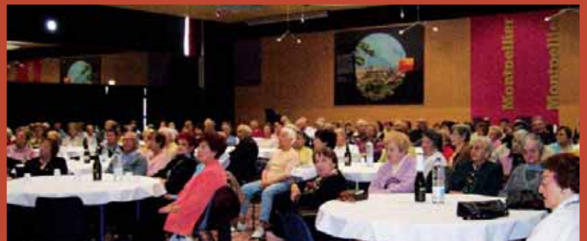
6 février. Les Tateurs d'Imit ont animé un spectacle à la salle des rencontres.