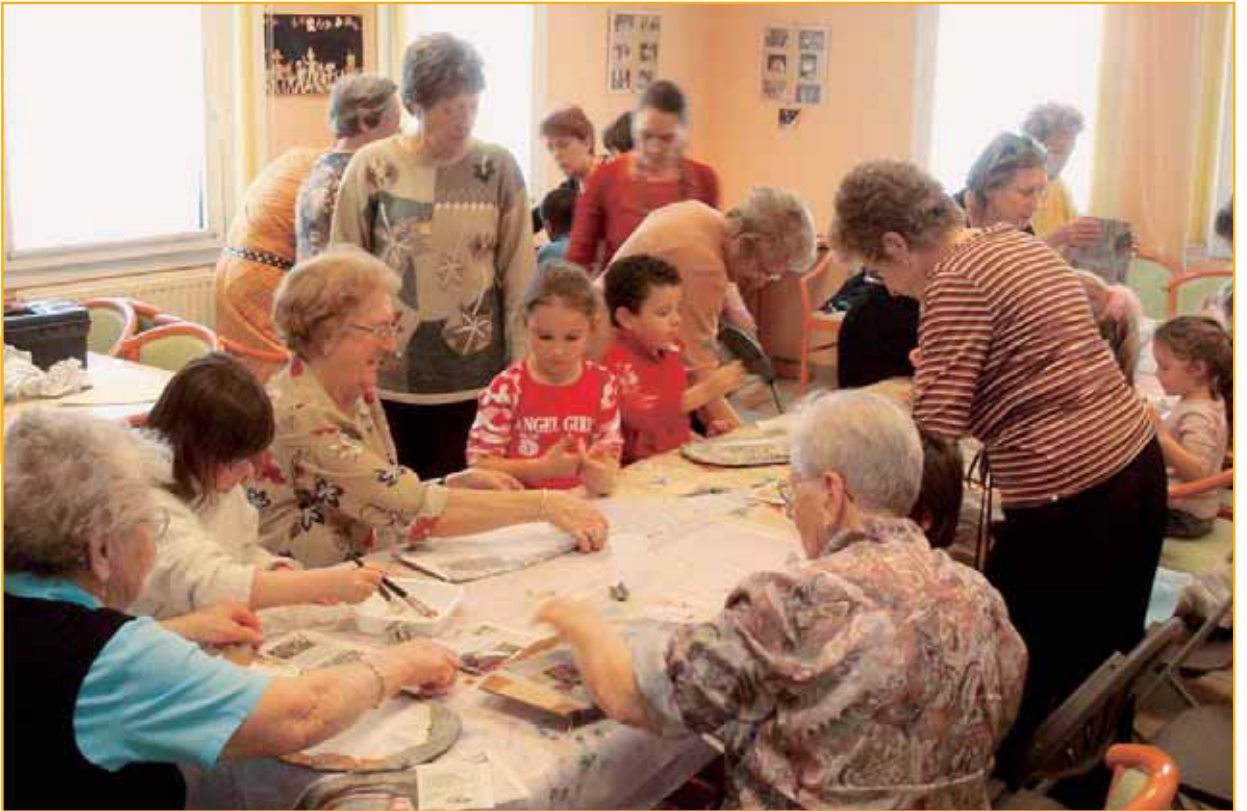
Au club Galzy

Intergénération, le mot est lancé, mais plus qu'un mot, ce nouveau type de rencontres fonctionne à 100%. Ces expériences partagées par les résidents des établissements pour personnes âgées (EPA), les adhérents des clubs de l'Age d'Or et les petits Montpelliérains ont commencé sur la pointe des pieds. Des rencontres qui se multiplient et font des petits à travers la ville.