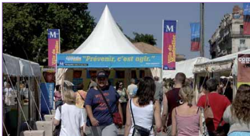
La deuxième Comédie de la santé aura lieu les 11 et 12 mai.