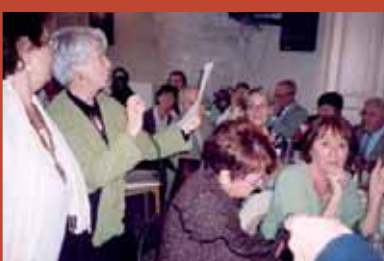
Un moment convivial au club Luis-Mariano, en décembre dernier.