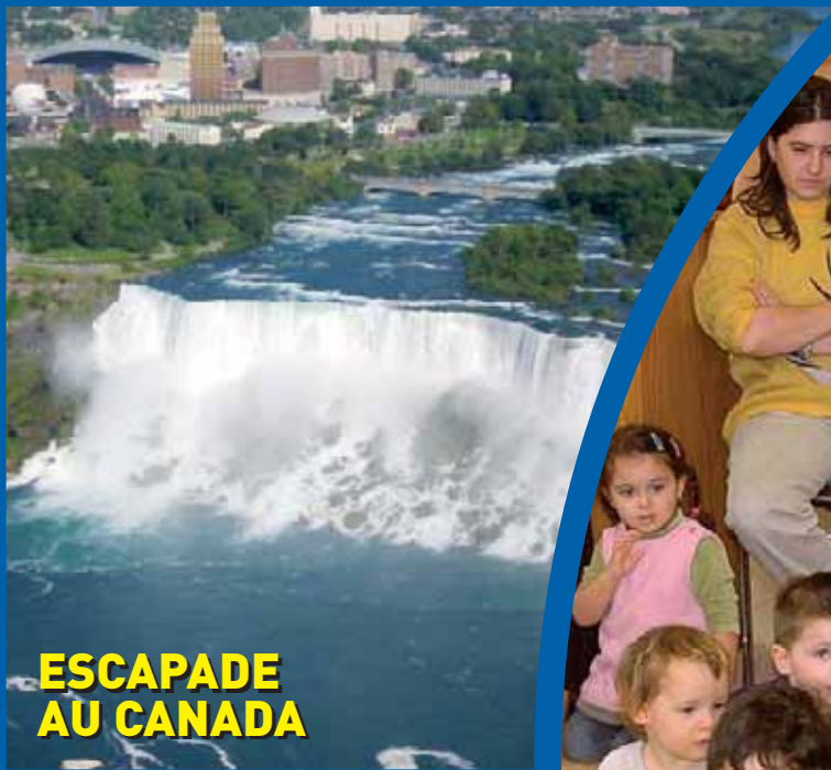
ESCAPADE AU CANADA

BULLETIN D'INFORMATION • N°68 Printemps 2007