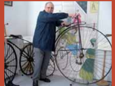
28 février. Sortie à Domazan (30). A la découverte des vieux métiers et du musée du vélo et de la moto.