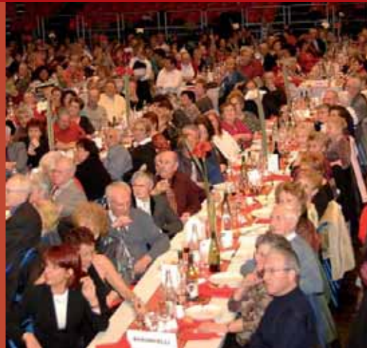
8 au 12 janvier. La fête du nouvel an offerte par la Ville et le CCAS a réuni près de 6000 adhérents des clubs Age d'Or qui ont apprécié le repas et la comédie musicale de l'orchestre XL.