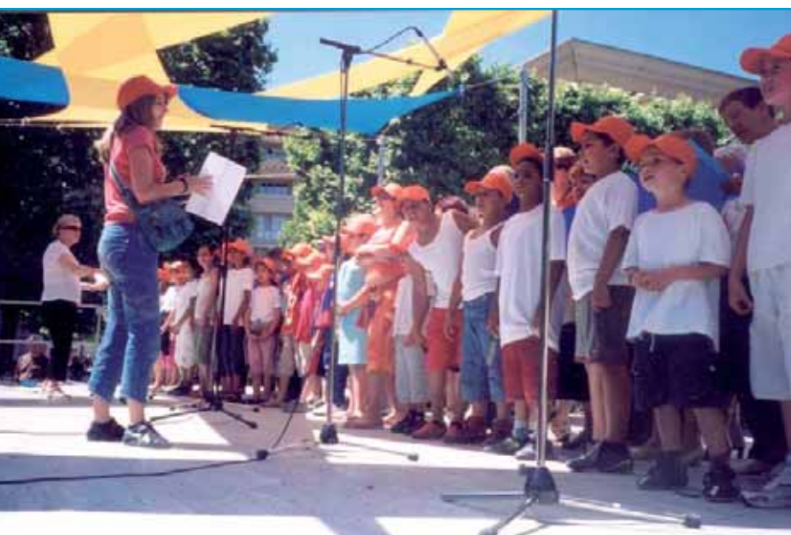
Les enfants participent aussi aux Olympiades.

La journée s'achèvera par la traditionnelle remise de trophées.