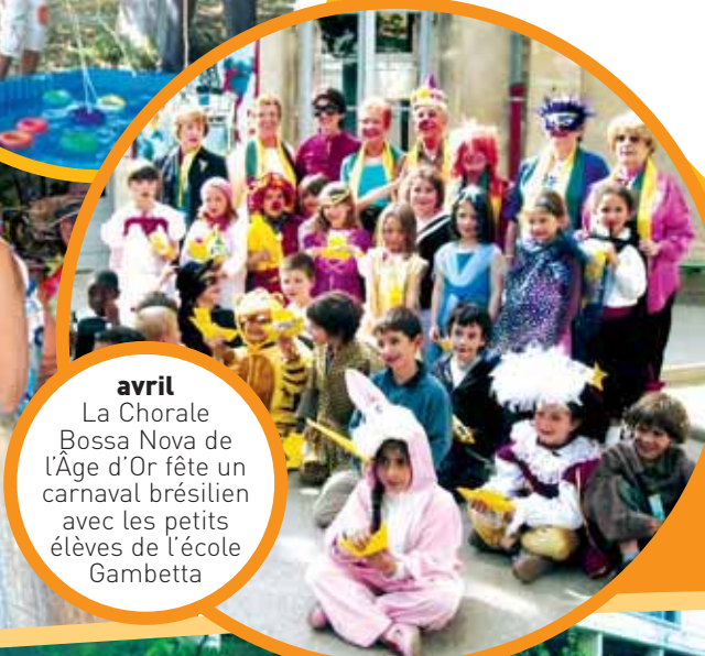
avril La Chorale Bossa Nova de l'Age d'Or fête un carnaval brésilien avec les petits élèves de l'école Gambetta