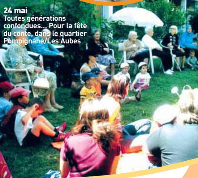
24 mai Toutes générations confondues... Pour la fête du conte, dans le quartier Pompignane/Les Aubes