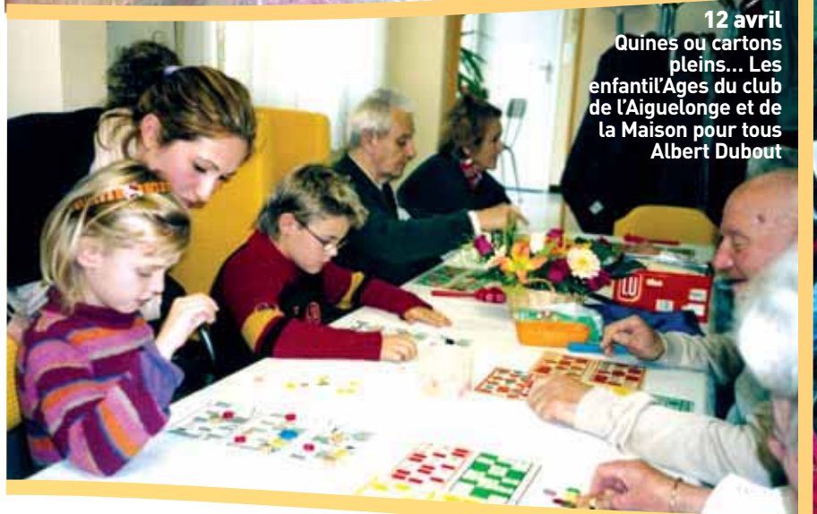
12 avril Quines ou cartons pleins... Les enfantl'Agés du club de l'Aiguelonge et de la Maison pour tous Albert Dubout