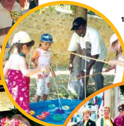
12 juin Les adhérents du club Luis Mariano et les enfants de la ludothèque en fête dans le parc de la Guirlande