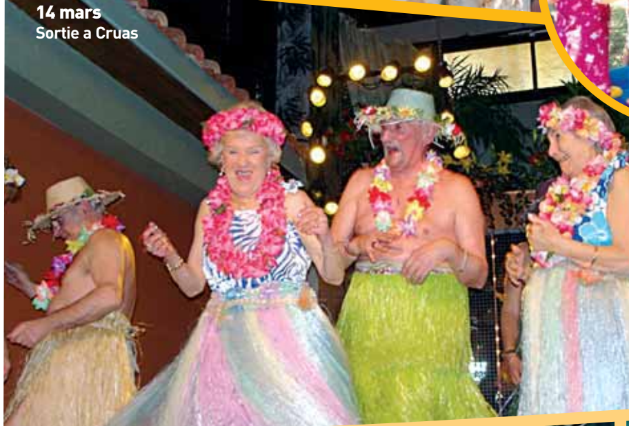
14 mars Sortie a Cruas