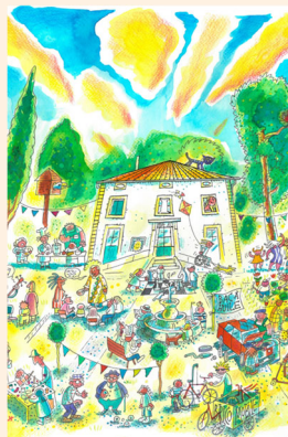
Illustration : Bertrand Lecointre

L'éducation populaire repose sur une conviction simple : chacun et chacune possède des savoirs, des talents, des expériences qui méritent d'être partagés. Elle ouvre des espaces où l'on apprend autrement, où l'on crée ensemble, où l'on se découvre capable. Elle encourage l'émancipation, la curiosité, l'entraide et le pouvoir d'agir — cette capacité à prendre part, à proposer, à transformer son quotidien et celui de son quartier.