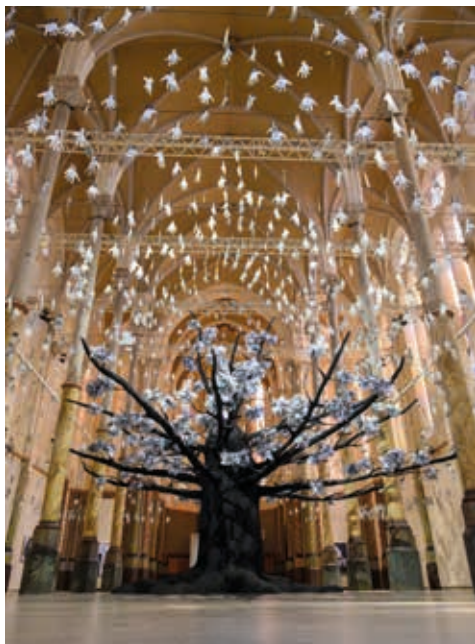
@ Montpellier Méditerranée Métropole

Le Carré Sainte-Anne est accessible aux Personnes à Mobilité Réduite (hall d'entrée, espaces d'exposition, sanitaires adaptés).