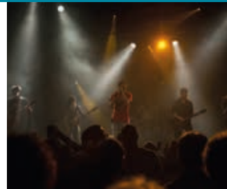
Victoire 2

Domaine du Mas de Grille 2, rue Théophraste Renaudot - Saint-Jean-de-Védas Tramway ligne 2 station Victoire 2