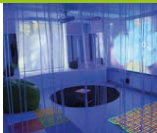
© M. Leirens Montpellier Méditerranée Métropole

13, avenue du Professeur Grasset - Montpellier (quartier Boutonnet) Tramway ligne 1 station Boutonnet-Cité des Arts Inscription possible toute l'année