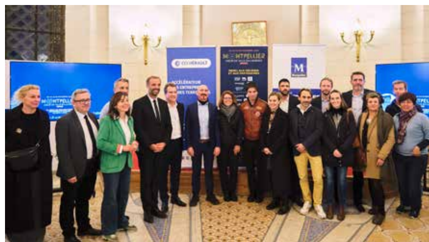
Lors de la soirée des Mécènes et Partenaires de Cœur de Ville en Lumières 2024.