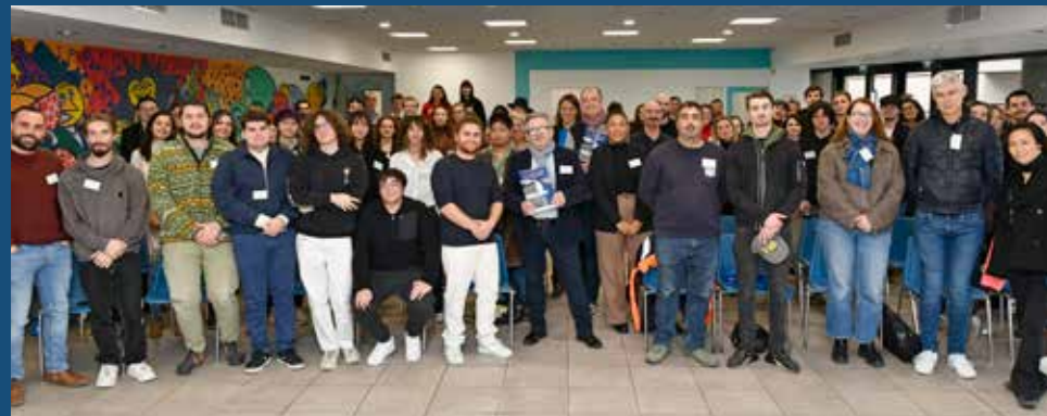
Les étudiants des écoles Créatives et culturelles lors de la rencontre avec les artistes professionnels de Cœur de ville en Lumière en 2024.

Le plan de communication et des contreparties possibles pour votre sponsoring est joint à cette plaquette.