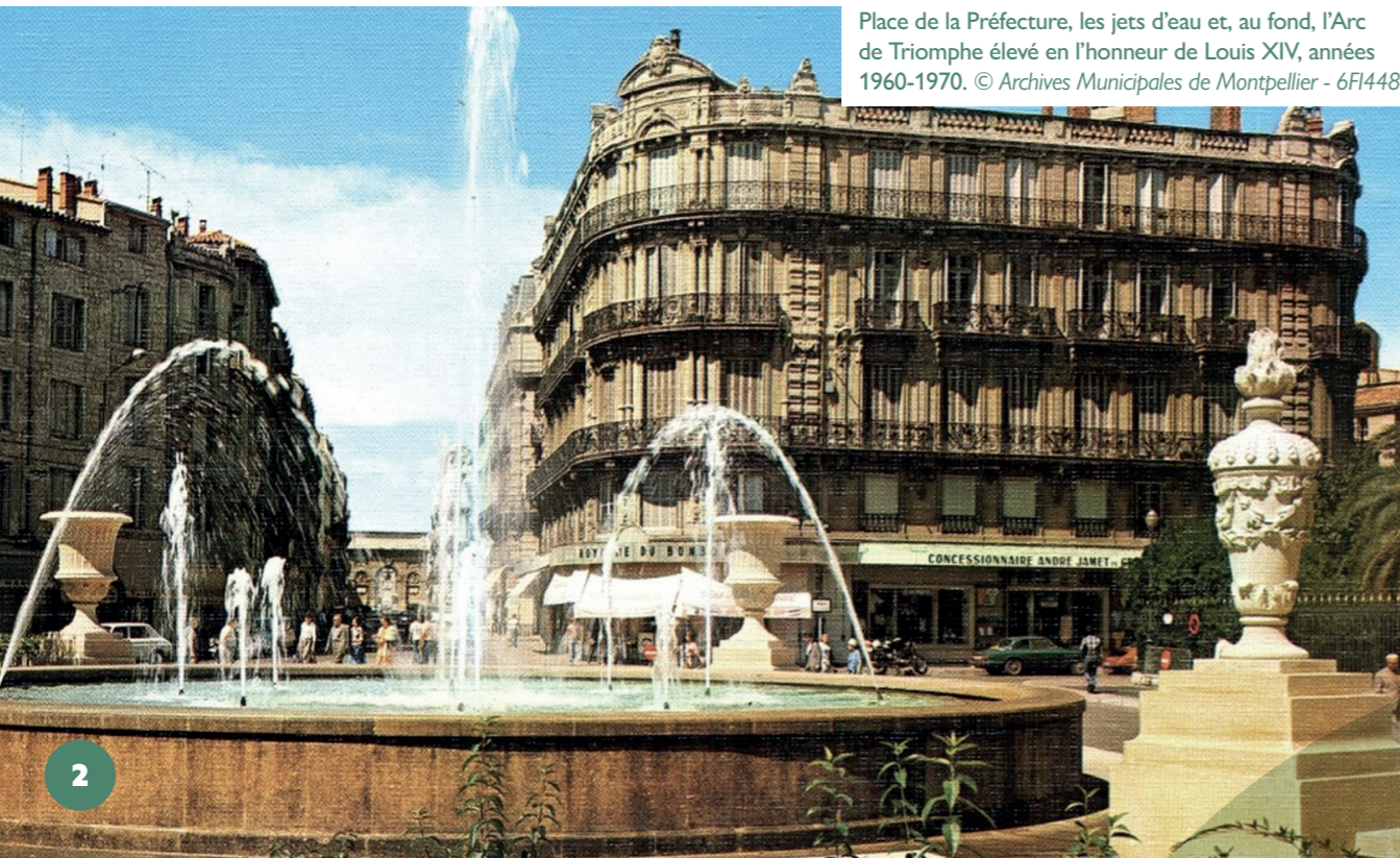
Place de la Préfecture, les jets d'eau et, au fond, l'Arc de Triomphe élevé en l'honneur de Louis XIV, années 1960-1970.