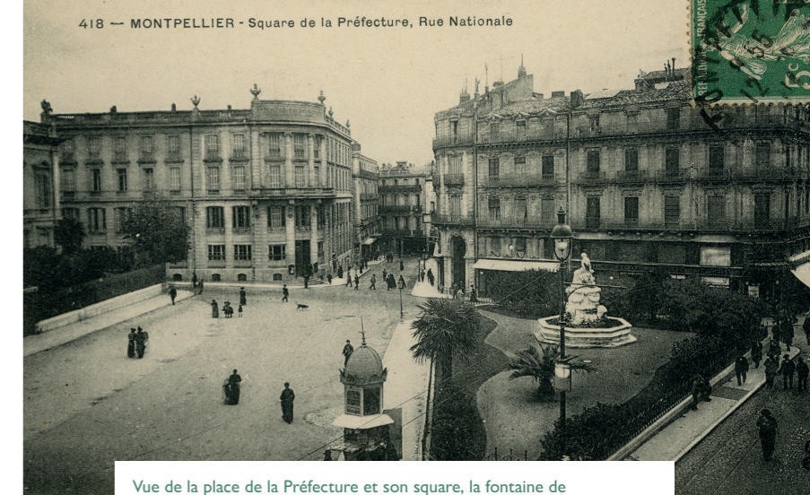
Vue de la place de la Préfecture et son square, la fontaine de l'Intendance, l'Hôtel des Postes, la rue Nationale (rue Foch) et la rue de la Loge, début XX e siècle. © Archives Municipales de Montpellier - 6F11724

En 2024, seront célébrés les 80 ans de la Libération de Montpellier. Ainsi le réaménagement de ce lieu emblématique de la ville est un bel hommage à l'histoire. La place de la voiture va être repensée pour favoriser le maintien des flux indispensables à la vie du centre-ville, tout en offrant aux piétons une nouvelle respiration.