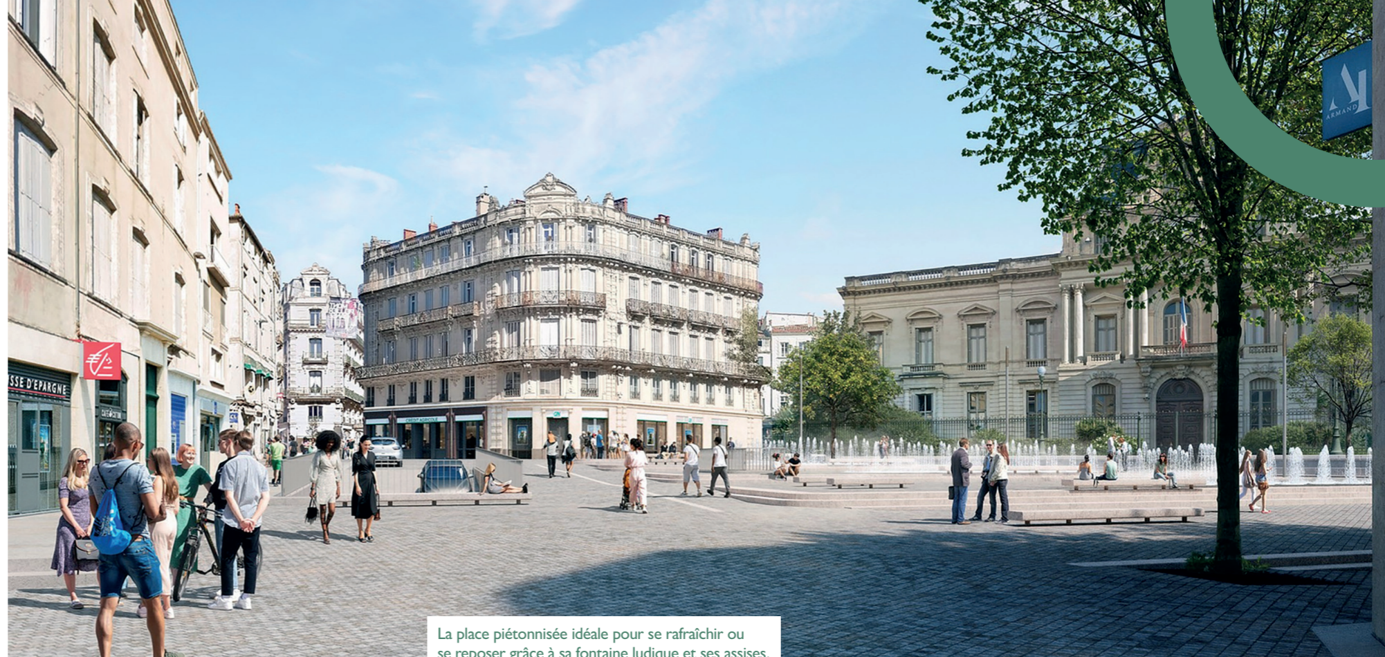
La place piétonnisée idéale pour se rafraîchir ou se reposer grâce à sa fontaine ludique et ses assises.