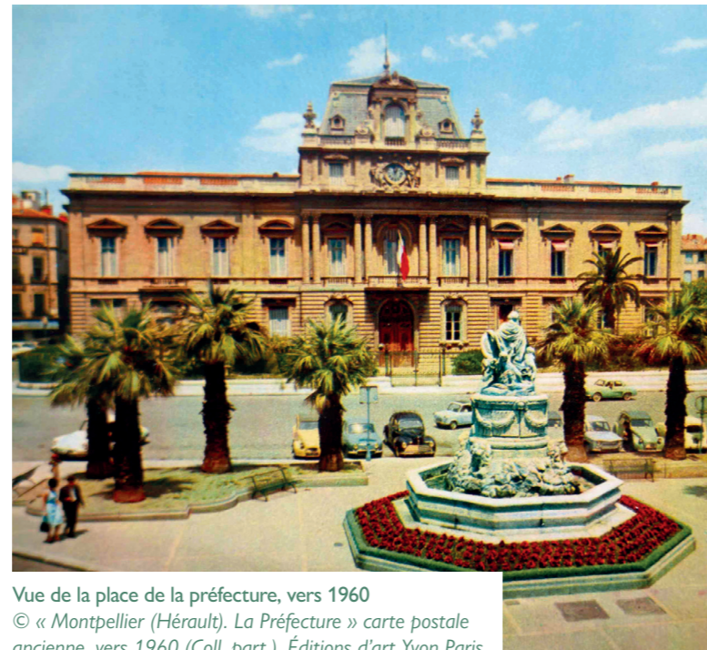
Vue de la place de la préfecture, vers 1960

Dans les années 70, dans l'optique de faciliter l'accès au cœur de ville, a été créé un parking souterrain, entraînant la surélévation de la place, et limitant la rue Foch à une fonction de circulation automobile.