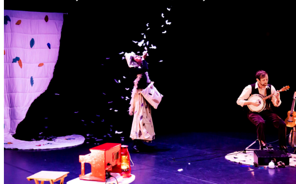
© Amanda Factory - Dame Hiver - Cie L'oiseau Lyre

Entrée libre, sur réservation + d'info au 04 48 18 62 14