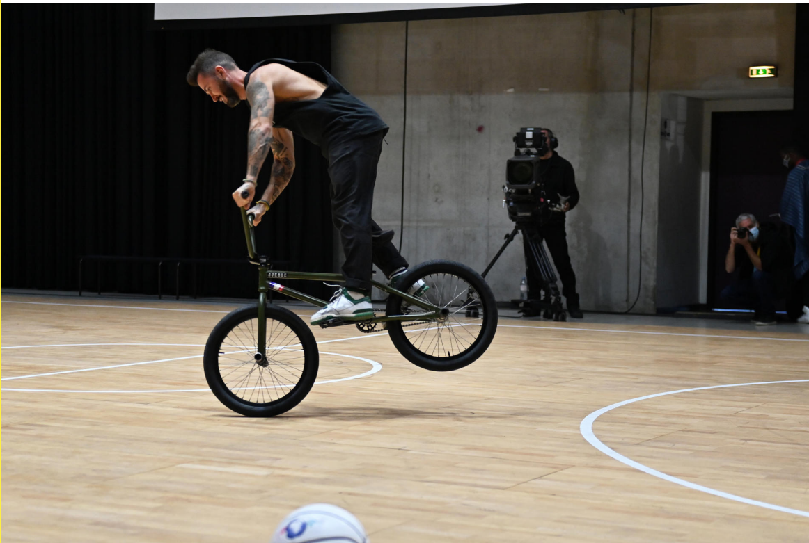
Démonstrations de breakdance et de BMX freestyle dans le cadre du Nouveau Sommet Afrique-France, octobre 2021.

Le territoire montpelliérain et son centre-ville, vibreront de nombreuses rencontres, débats, échanges artistiques et novateurs : un plateau radio pour parler de la coopération dans le monde de la musique, des échanges et événements autour du skate et du breakdance sera organisé.