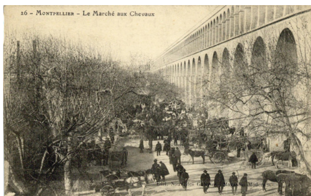
Archives de Montpellier

Depuis, a été organisée l'incroyable ZAT des Arceaux, les 10 et 11 novembre 2012, où se sont tenus deux jours de spectacles, de performances, de débats et de fêtes autour de deux thèmes liés à l'histoire et à la vie de quartier : résistances et réjouissances.