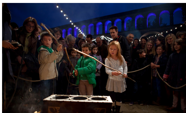
La Kermesse pyrotechnique et culinaire de la compagnie La Machine - ZAT des Arceaux 2012

Un demi-siècle plus tard, cet espace emblématique doit renouer avec ses usages passés et mérite d'être rénové et embelli pour redonner tout son éclat au cœur de la cité devenue métropole.