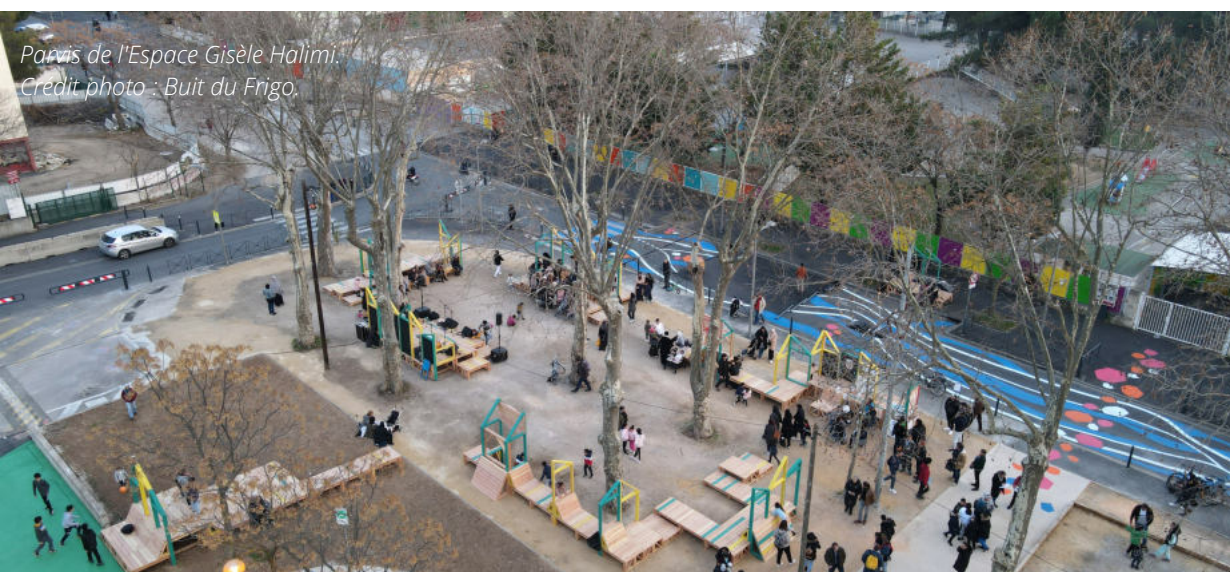
Parvis de l'Espace Gisèle Halimi.

Ainsi, le Plan de Sauvegarde en lien avec le projet de renouvellement urbain, permettra de redresser de façon pérenne la copropriété à la fois à l'échelle de l'immeuble sur les volets gestion, gouvernance et travaux pour les thématiques traitées via le plan de sauvegarde et à l'échelle du quartier avec une meilleure ouverture de la copropriété sur la ville et la résolution de problématiques foncières pour améliorer la gestion des espaces extérieurs.