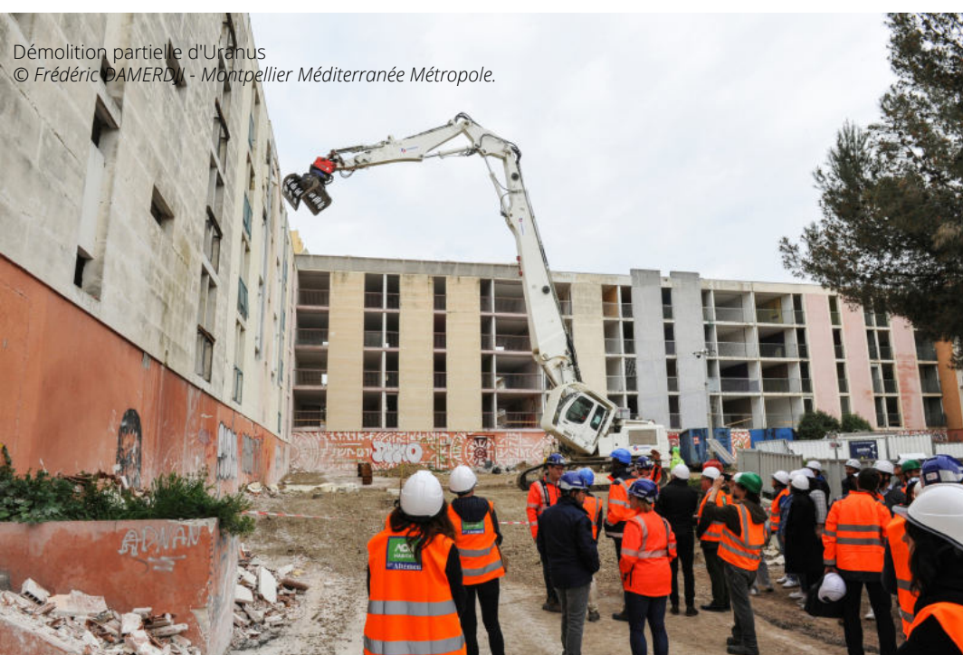
Démolition partielle d'Uranus © Frédéric DAMERDJI - Montpellier Méditerranée Métropole.

Soit un montant global d'investissement du projet de renouvellement urbain pour les quartiers Mosson Cévennes qui s'élève à environ un demi-milliard d'euros HT, tous maîtres d'ouvrage confondus.