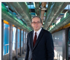
Laurent LE BON Président du Centre Pompidou

Ce projet illustre la stratégie de coopération territoriale du Centre Pompidou, qui vise à renforcer et à inscrire dans la durée les projets avec nos partenaires locaux.