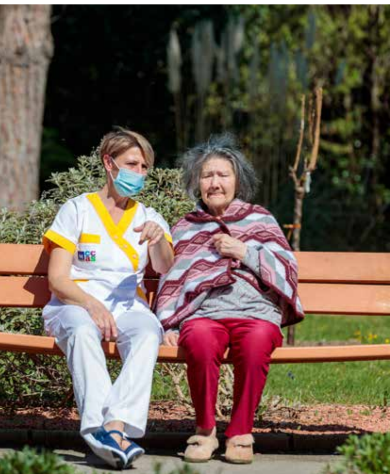
Résidence Les Aubes

1 Pôle d'Activités et de Soins Adaptés de 14 places