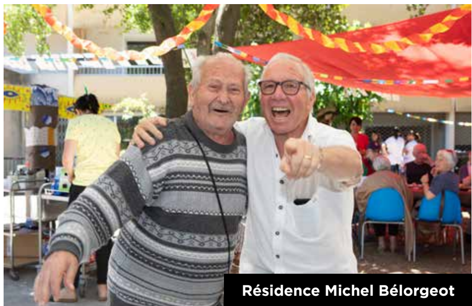
Résidence Michel Bélorgeot

Au cœur du parc Bel Juel, cette résidence inaugurée en 1981 a été rénovée en 2015, afin de mieux répondre à vos attentes et besoins. C'est un véritable coin de campagne en ville installé au sein du quartier animé de Celleneuve, réputé pour sa douceur de vivre. L'établissement favorise les rencontres et les échanges intergénérationnels via des partenariats avec des écoles du quartier, la Maison pour tous, etc.