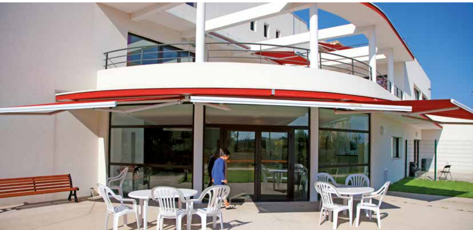
Résidence Pierre Laroque

80 chambres de 15 à 20m 2 , dont 2 en hébergement temporaire