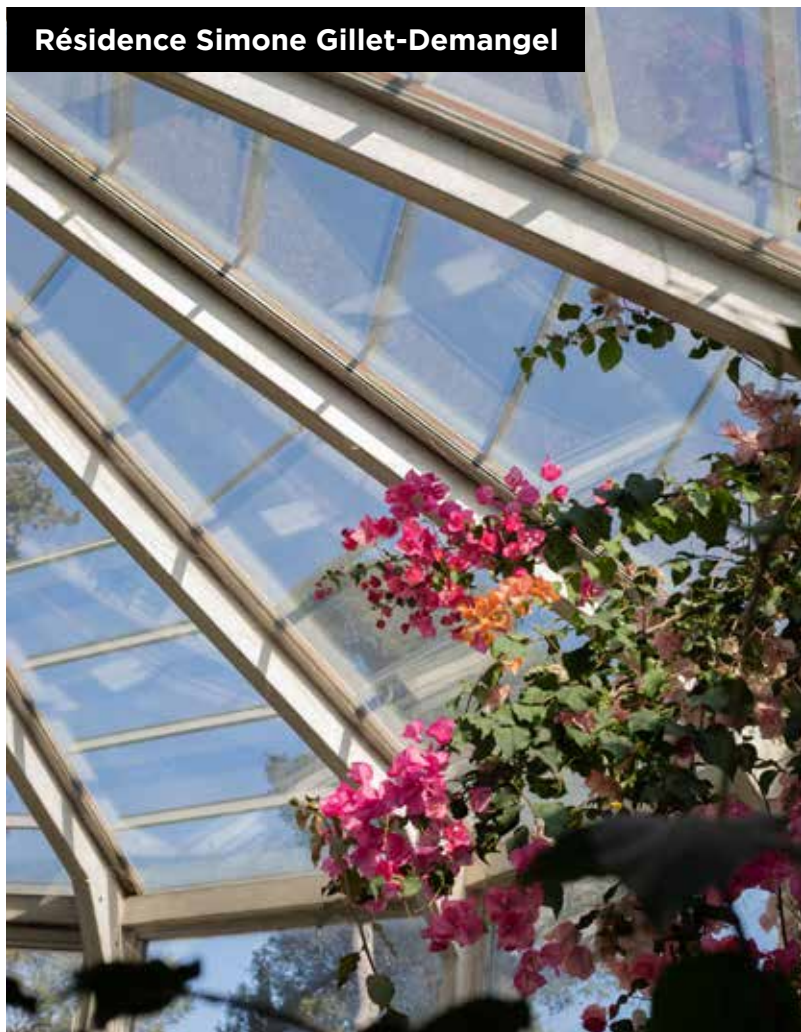
Résidence Simone Gillet-Demangel

82 chambres de 22m 2 , dont 2 chambres doubles 10 lits en secteur protégé 1 Pôle d'Activités et de Soins Adaptés de 14 places