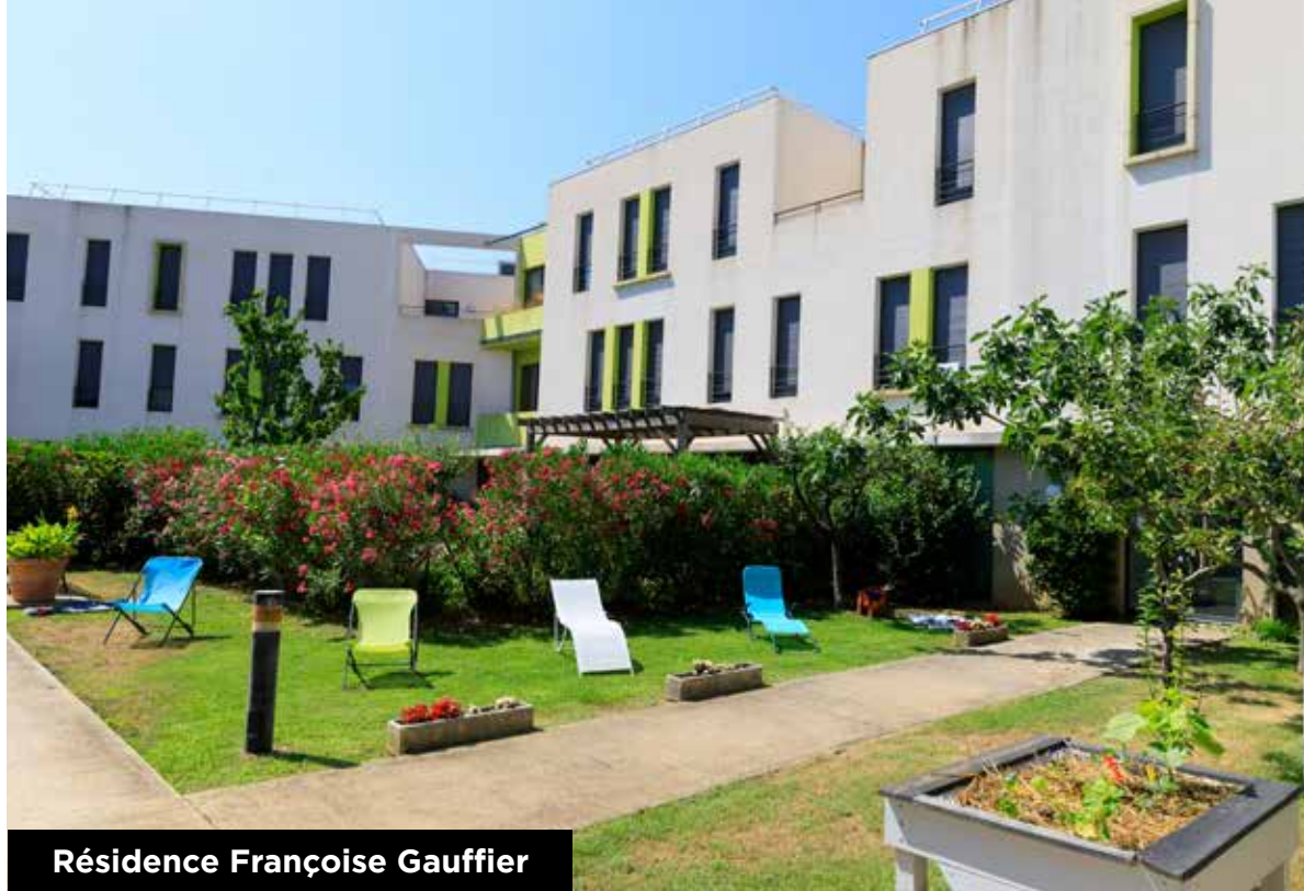
Résidence Françoise Gauffier