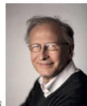
Pr Alain Fischer