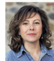
Carole Delga Présidente de la région Occitanie/ Pyrénées-Méditerranée

D'abord, je défends une gestion de proximité avec plus de responsabilités aux mains des régions. Nous l'avons fait pour les lycées, et cela fonctionne. Avec un système de santé plus décentralisé, nous gagnerons en réactivité et pourrons apporter des solutions sur mesure, territoire par territoire.