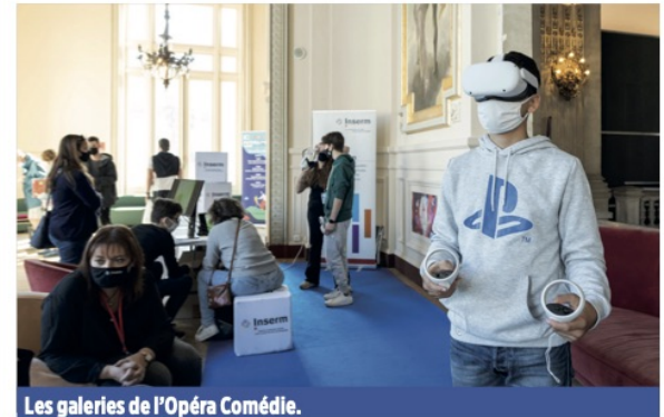
Les galeries de l'Opéra Comédie.

Dans le cadre de la lutte contre les déserts médicaux, la région Occitanie recrute des médecins à temps plein ou à temps partiel dans divers territoires urbains, péri-urbains, littoraux ou encore de montagne. Pour en savoir plus, rendez-vous sur le stand de la région.