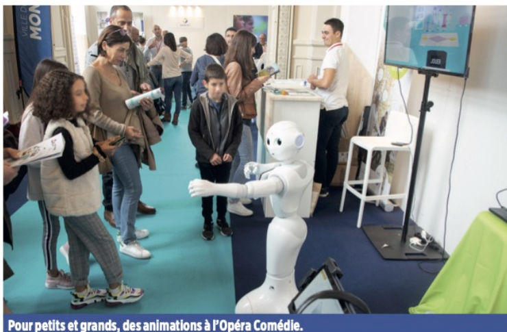
Pour petits et grands, des animations à l'Opéra Comédie.

Rendez-vous dans la Galerie de l'Opéra Comédie pour toucher l'innovation de ses mains.