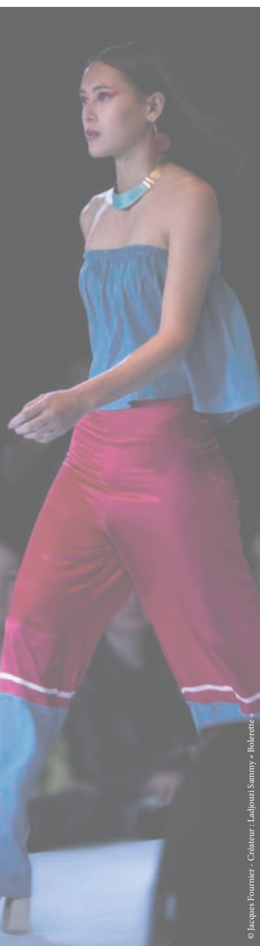
© Jacques Fourmier - Créateur : Ladjouzi Sammy « Bolereite »

De 9h à 12h30 et de 14h à 19h, vendredi de 9h à 12h30 et de 14h à 18h (vacances scolaires fermeture à 18h tous les jours).