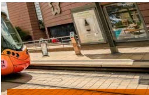
Bandes d'information voyageur aux arrêts de tram