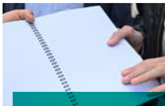
Plan en Braille