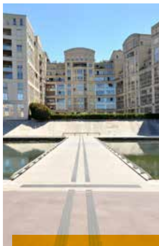
Passerelles du Lez