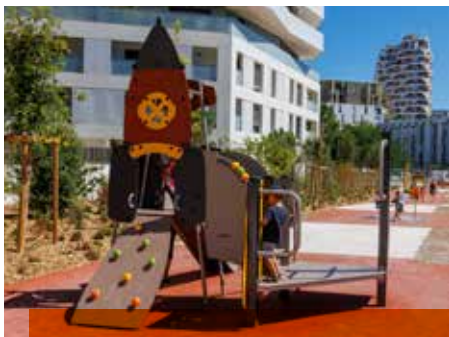
Parc René Dumont