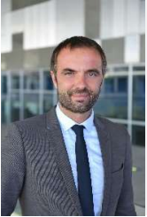
Michaël DELAFOSSE, Maire de la Ville de Montpellier, Président de Montpellier Méditerranée Métropole

Cet aménagement fait partie du Réseau Express Vélo que nous sommes en train de construire. À l'image du futur réseau structurant en transports collectifs (constitué des deux lignes de TER, des 5 lignes de tramways et des 5 lignes de busstram), il sera un réseau cyclable continu, sécurisé et confortable de 235 km. Il reliera les cœurs de village des communes au cœur de la Métropole jusqu'à la place de la Comédie, mais aussi les communes du territoire entre elles.