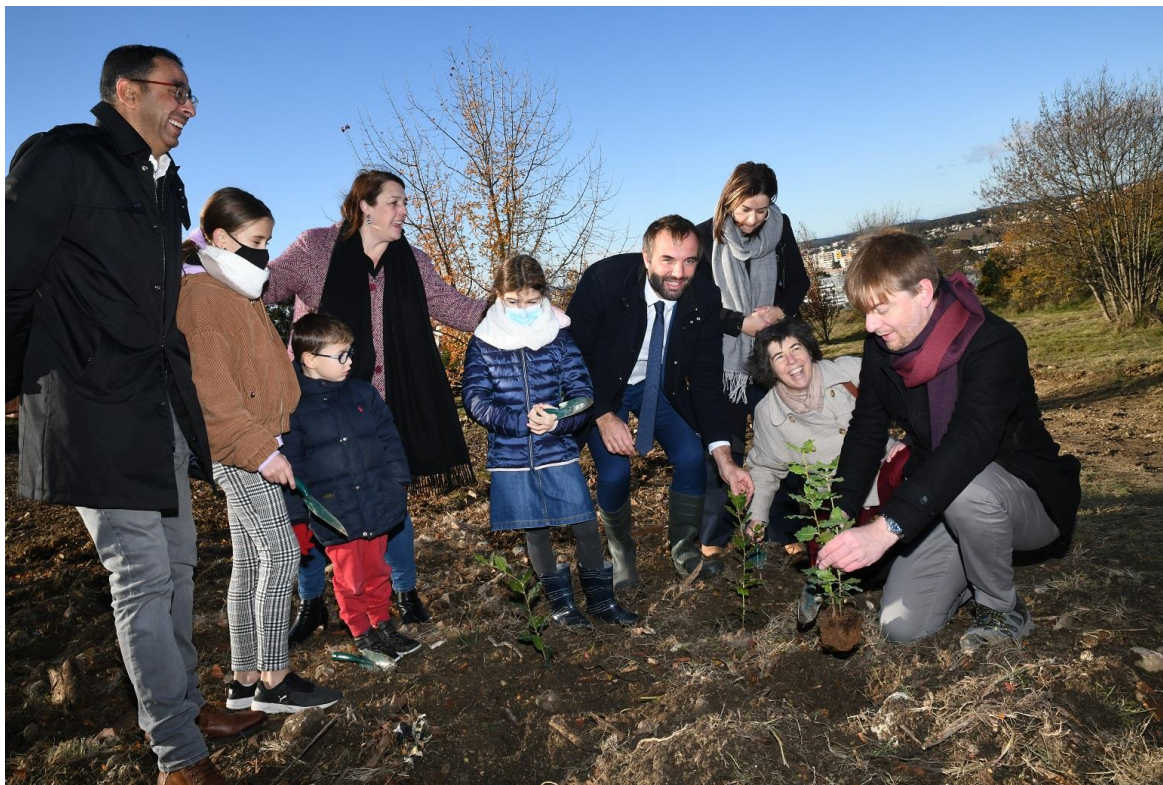
Plantation d'arbres quartier Malbosc en décembre 2021