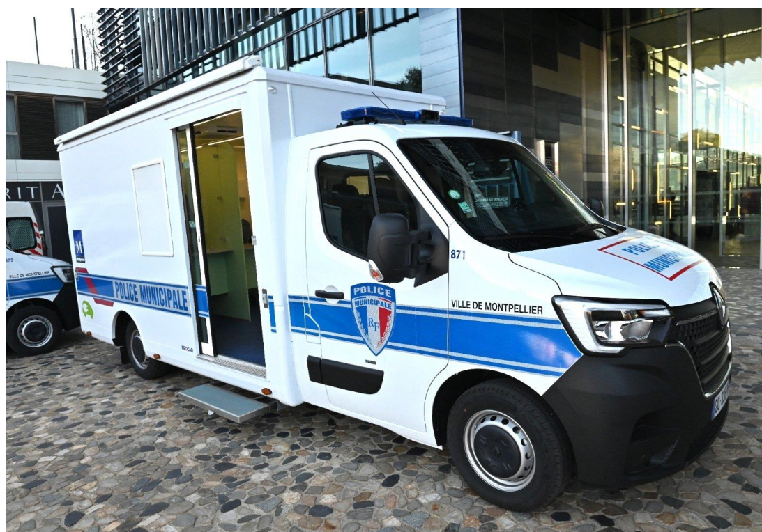
Poste de Commandement mobile de la Police municipale.

Engagés pour agir pour la sécurité des Montpelliérains