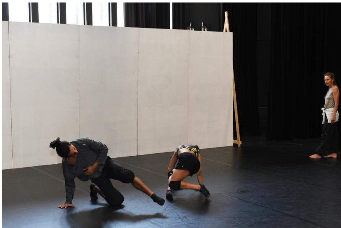
Résidence d'artistes au théâtre La Vista

L'appel à projets est lancé jusqu'au 28 février 2022.