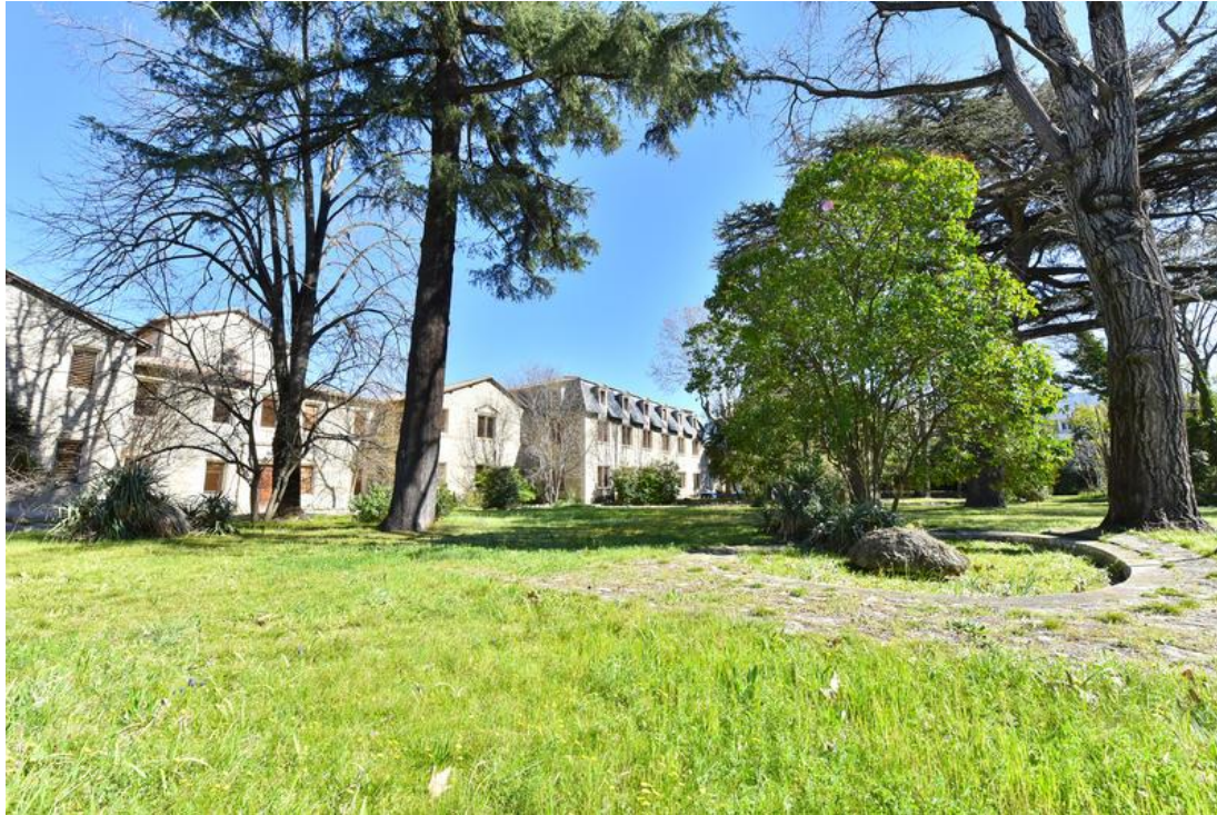
Parc de l'Aspirant Tastavin

Cette dénomination vient rendre hommage à une Montpelliéraine résistante reconnue Juste parmi les nations et habitante du quartier voisin des Beaux-Arts, sa pension de famille qui abritait des enfants juifs était en effet située rue de Nazareth. Suzanne Babut était également la petite fille du célèbre botaniste Jules-Émile Planchon.