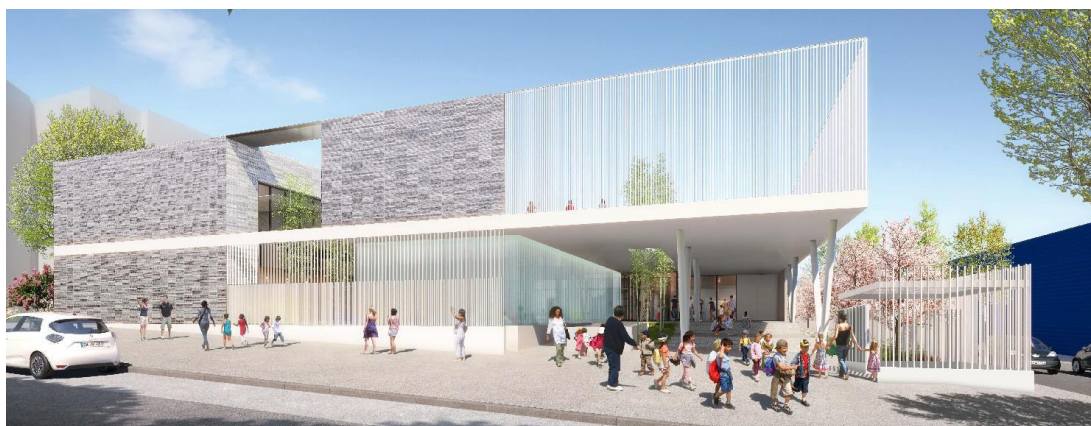
Perspective du groupe scolaire Lucie Aubrac/ Samuel Paty

Ainsi, 1,8 M€ sera dédié au groupe scolaire Lucie Aubrac/ Samuel Paty (10 classes élémentaires et 5 classes de maternelle, ouverture septembre 2022),