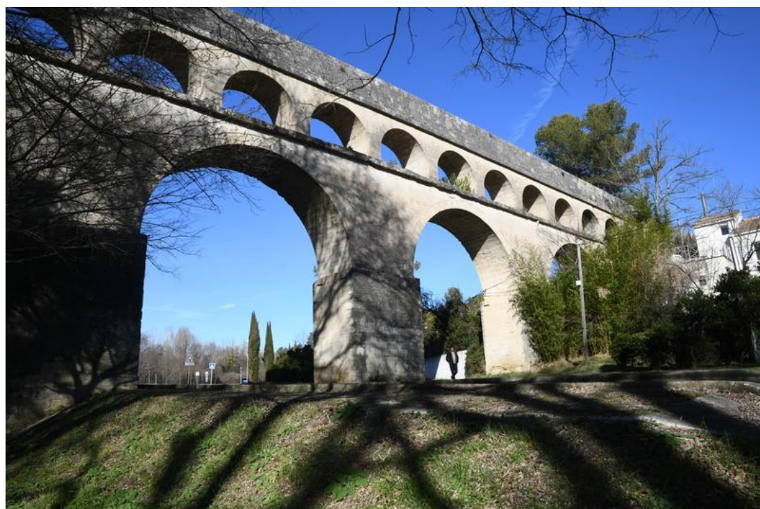
Aqueduc Saint-Clément 2021

Le Conseil municipal propose donc de lancer une mission d'assistance à maîtrise d'ouvrage pour préciser les interventions à engager en matière d'espace public pour retrouver le « chemin de l'aqueduc » et définir une stratégie d'intervention patrimoniale intégrant le phasage des travaux de protection de l'aqueduc au-delà du groupe scolaire Arc-Chaptal.