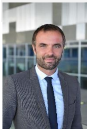
Michaël DELAFOSSE, Maire de la Ville de Montpellier, Président de Montpellier Méditerranée Métropole Président du CCAS de Montpellier

Dans un lieu de rencontres et de mixité sociale, le CEIS déploiera ses quatre plateformes clés - budget, santé, emploi numérique - et de nouveaux services autour de l'alimentation durable pour tous : épicerie sociale et solidaire, ateliers cuisine, jardin partagé. Accompagnés par une équipe pluridisciplinaire de qualité, les Montpelliéraines et Montpelliérains seront accueillis avec écoute et bienveillance dans un lieu ressource en plein cœur du centre-ville.