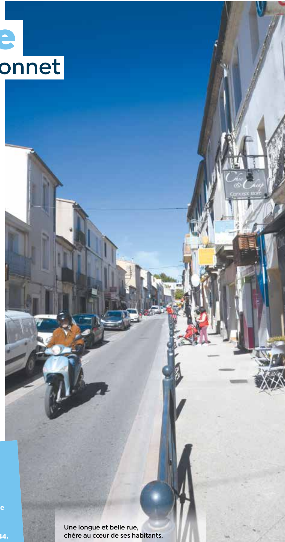
Une longue et belle rue, chère au cœur de ses habitants.