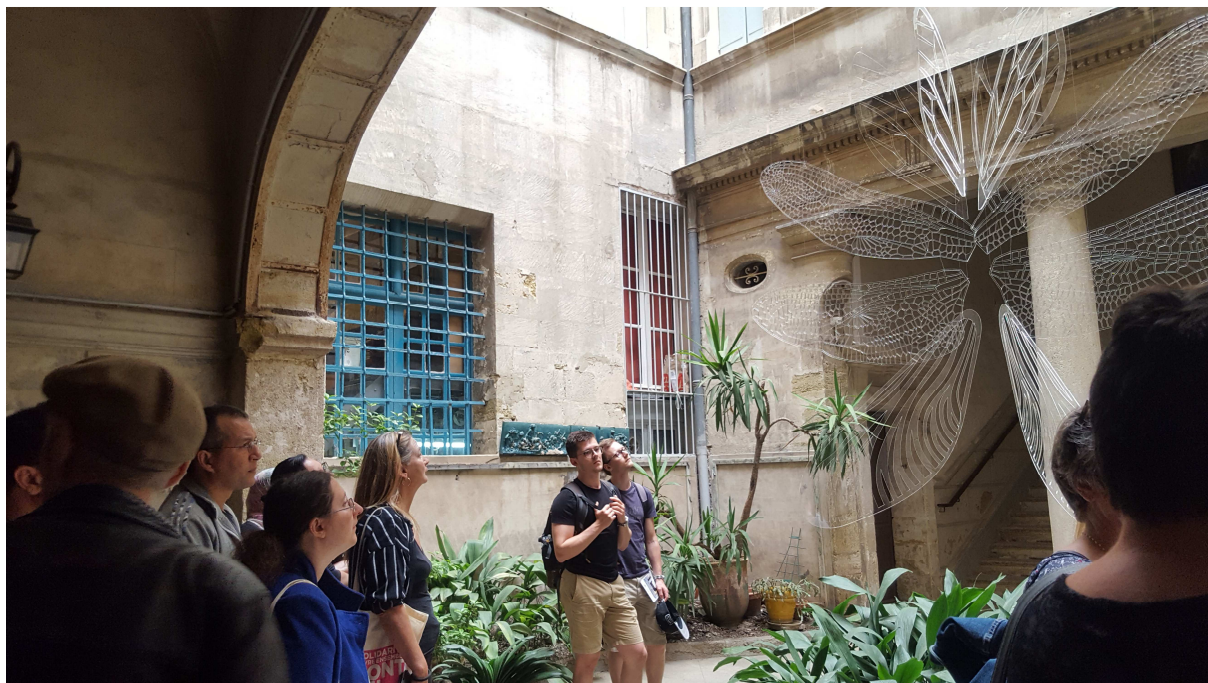
Visite du centre-ville de Montpellier à l'occasion des Architectures Vives

Au sein d'un lieu convivial et stimulant, le dispositif Unis' Vers en partenariat avec Pôle emploi est donc conçu pour accompagner des groupes d'une 20aine de personnes, permettant de travailler à la fois sur les problématiques singulières des participants par un accompagnement social individuel, et de proposer en parallèle, des actions collectives stimulantes. Pour le CCAS, il a paru nécessaire de mener une action novatrice en faveur des Montpelliérains et d'agir autrement ensemble en coordonnant les acteurs locaux. Il s'agit d'une action pluridisciplinaire visant l'inclusion sociale des publics comme levier à l'insertion professionnelle.