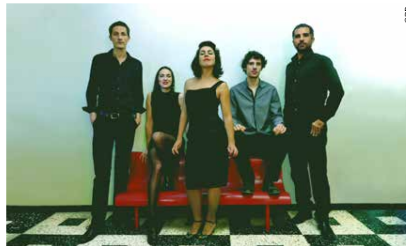
Rose Betty Klub

Drôles, énergiques, et faussement nostalgiques, les concerts du Rose Betty Klub sont une assurance contre la morosité.