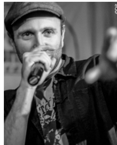
Trobar Dub Sound

Réunis par la passion du swing, Les Miraculous Swingers font revivre le répertoire des années 30 avec un enthousiasme communicatif. Django Reinhardt bien sûr, mais aussi Nat King Cole, Cole Porter, sont ici à l'honneur. Avec le talent, la puissance et l'élégance qui les caractérisent, les musiciens vous entraînent irrésistiblement dans l'univers des guitares et du style de l'époque.