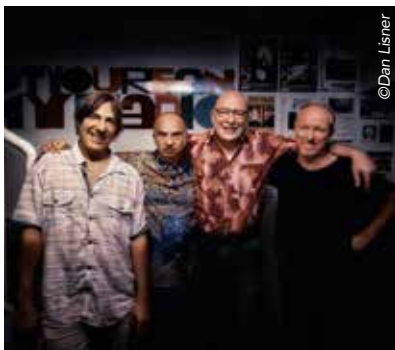
Le Band Original