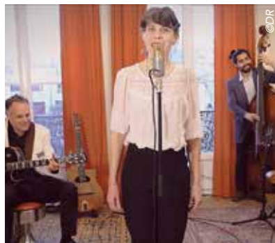
Les Miraculous Swingers

Ce quatuor formé en septembre 2016, joue un répertoire essentiellement constitué de reprises, d'adaptations de musiques de films et de séries. Des morceaux, pour la plupart, très populaires, composés par de grands noms : Vladimir Cosma, Lalo Schifrin, Francis Lai, Ennio Morricone pour n'en citer que quelques-uns. Les morceaux et styles abordés sont des plus variés, passant du musette au rock, du jazz à la musique classique. Avec un son très acoustique B.O interprète un répertoire rare ; l'occasion pour les auditeurs de se replonger dans des souvenirs cinématographiques.