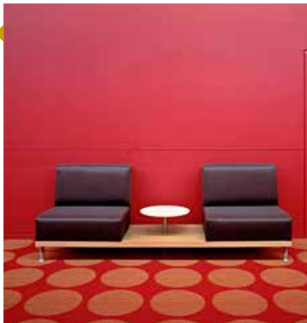
© Lynne Cohen LC - Untitled (Red Door), 2007 (print entrecollé sur dibond (2010) édition 1/1, 190x250cm - Collection Neulufize OBC