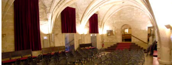
Salle Pétrarque © Ville de Montpellier

9 salles municipales complètement équipées peuvent être louées aux associations montpelliéraines, à un tarif symbolique, après validation de la demande par le service.