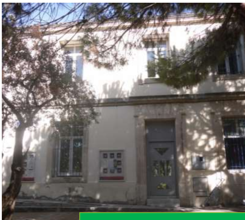
Ecole maternelle Marie Pape-Carpantier