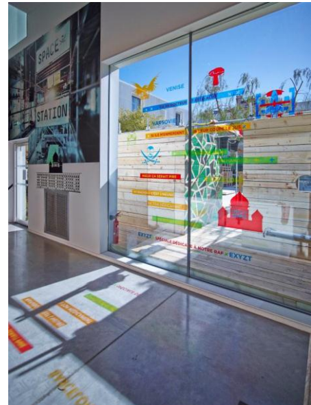
Exposition Machine à habiter, 2015

Lieu de rencontres, d'échanges et de métissages entre différentes disciplines artistiques, La Panacée est une véritable plateforme créatrice et expérimentale et propose à tous les publics d'expérimenter une relation renouvelée à l'art. Entre spectateur et acteur, chacun peut interroger ses représentations et ses pratiques comme l'invite à le faire la création artistique contemporaine.