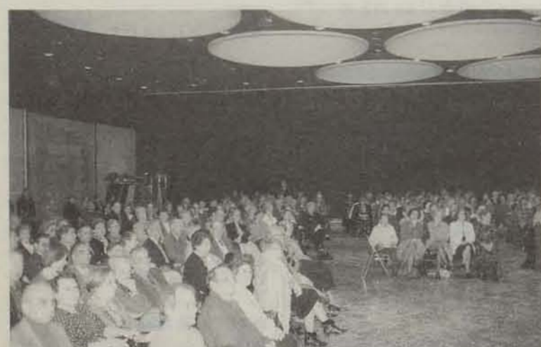
La traditionnelle Galette des Rois de l'Université du Tiers Temps, aura lieu, à la Salle des Rencontres, le 19 janvier à 15h.