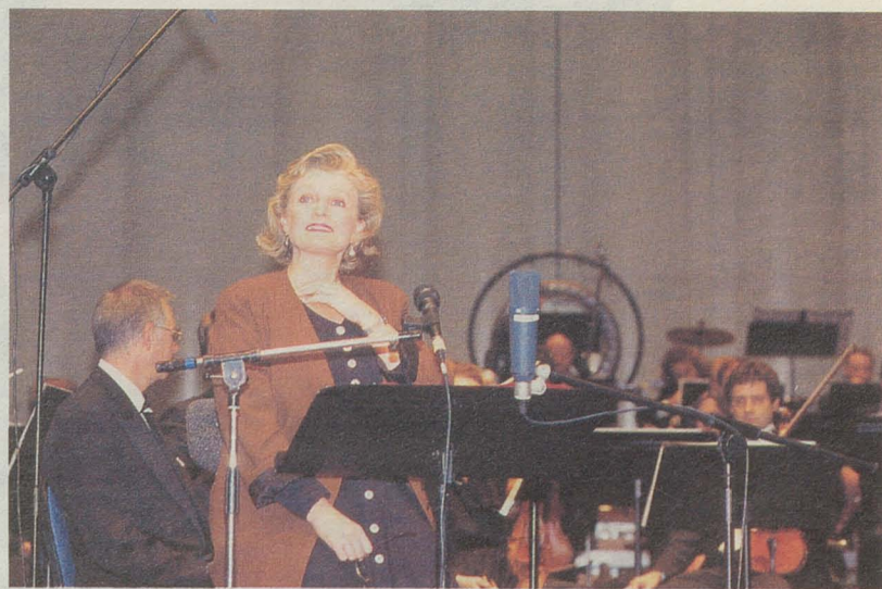
Marie-Christine Barrault à l'Opéra-Berlioz, le 20 décembre, lors du Concert Educatif offert aux enfants des écoles