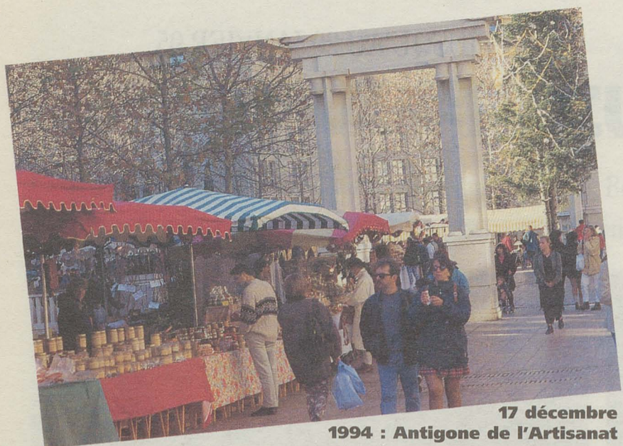
17 décembre 1994 : Antigone de l'Artisanat