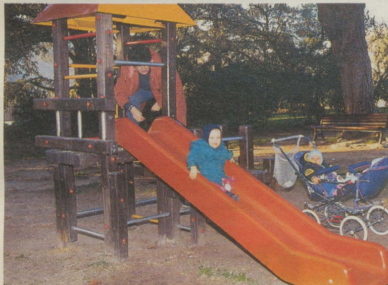
Promenade au square ; une ouverture sur le monde extérieur.

Il existe à Montpellier trois crèches familiales municipales, une crèche familiale associative et une crèche familiale gérée par le CHR. Les trois crèches familiales municipales comptent 120 assistantes maternelles dont 6 postes fixes, et offrent 250 places d'accueil. Des locaux sont mis à la disposition des assistantes maternelles qui peuvent venir avec les enfants dont elles ont la garde quelques heures par semaine pour dialoguer avec l'équipe de direction de la crèche et échanger leurs expériences avec d'autres collègues. Le mercredi, une éducatrice jeunes enfants accueille les enfants de plus de deux ans pour des animations qui les préparent à l'école maternelle.