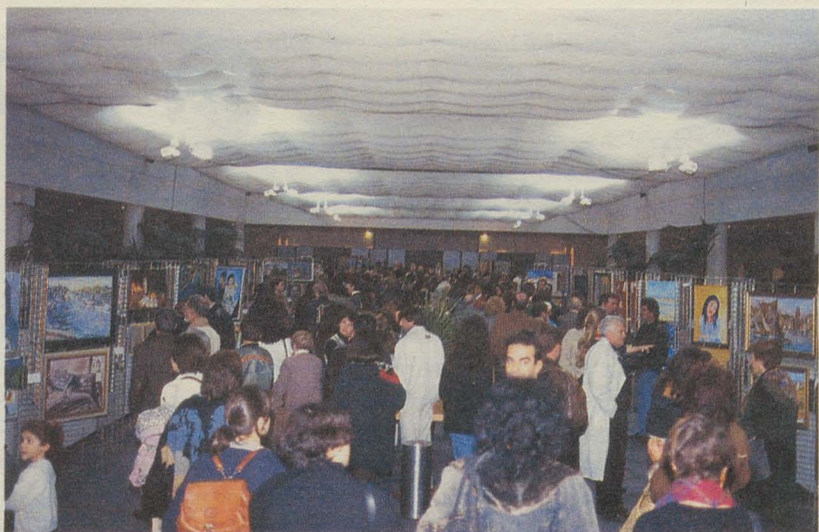
240 artistes, 450 toiles exposées pour le 2ème Corum des Peintres, organisé du 2 au 3 décembre