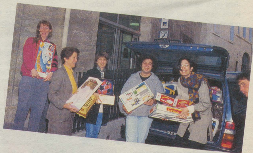
Comme chaque année, l'Opération «Je donne un jouet» et le concert «Les Rockers ont du Coeur», ont permis au CCAS de redistribuer de nombreux cadeaux aux enfants défavorisés