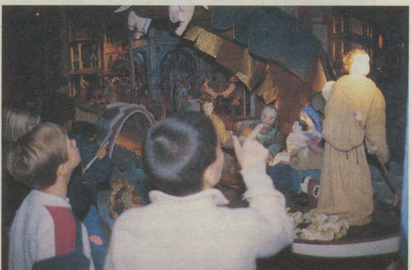
La crèche de Venise, sur l'Esplanade, jusqu'au 8 janvier