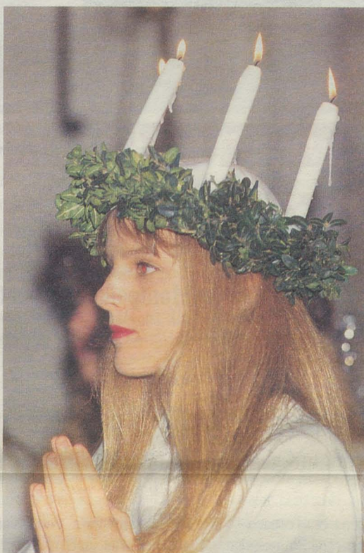
Sainte-Lucie, fête scandinave, célébrée à Grammont, le 11 décembre