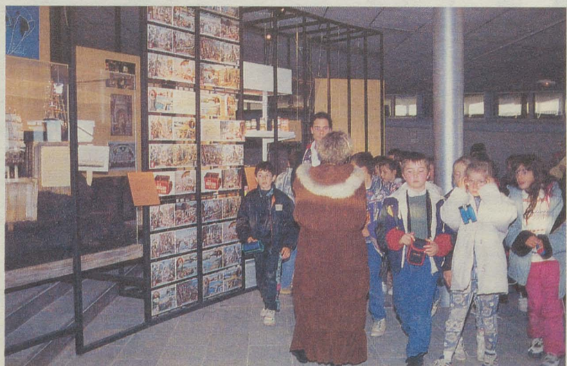
L'exposition «Paysans et Paysages du Monde» à Agropolis Muséum, ouverte gratuitement aux écoles primaires