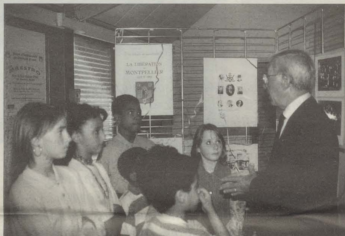
Pour fêter l'anniversaire de la Libération de Montpellier, l'AURCAES et la Maison Pour Tous avaient organisé un spectacle et une exposition avec les jeunes du quartier

L'Association Urbaine et Régionale pour la Culture et l'Animation Educative, AURCAES, travaille en partenariat avec la Maison pour Tous Georges Brassens à la socialisation des jeunes de la Paillade, contre l'exclusion.