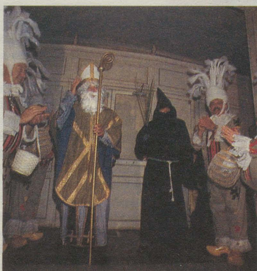
Saint-Nicolas, le Père Fouettard et son cortège de Gilles, accueillis à l'Opéra-Comédie, le 3 décembre