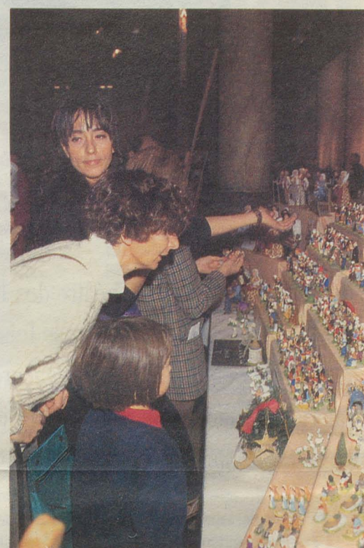
La Foire aux Santons au Carré Sainte-Anne, le 10 décembre