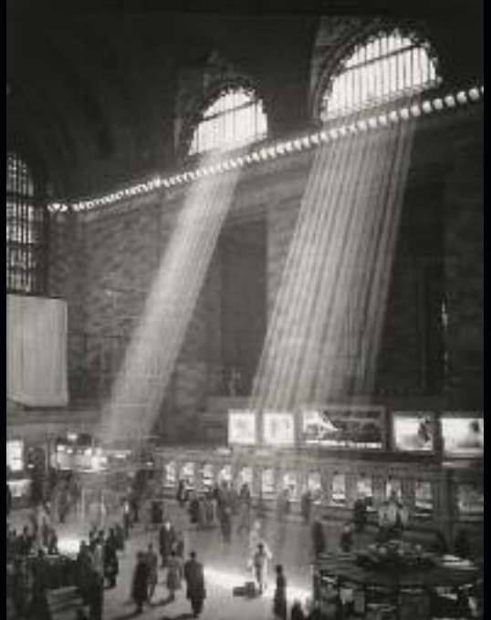
Grand Central Station, New York - 1957