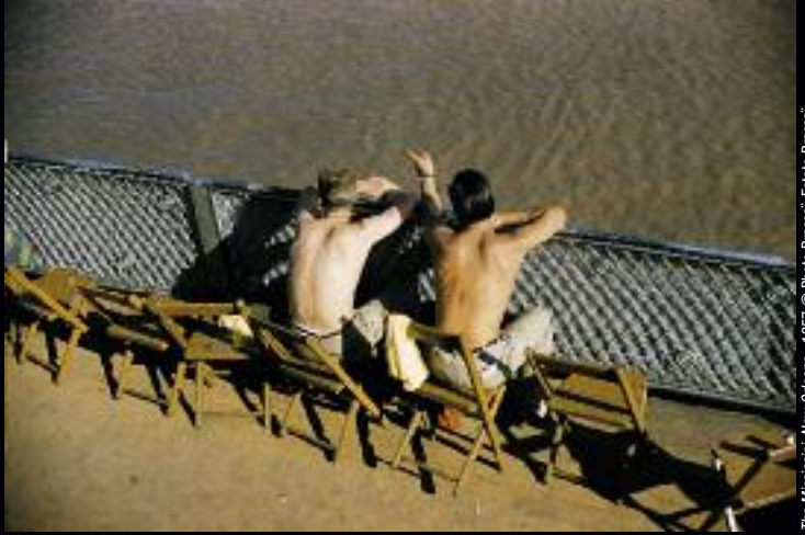
The Mississippi, New Orleans - 1957