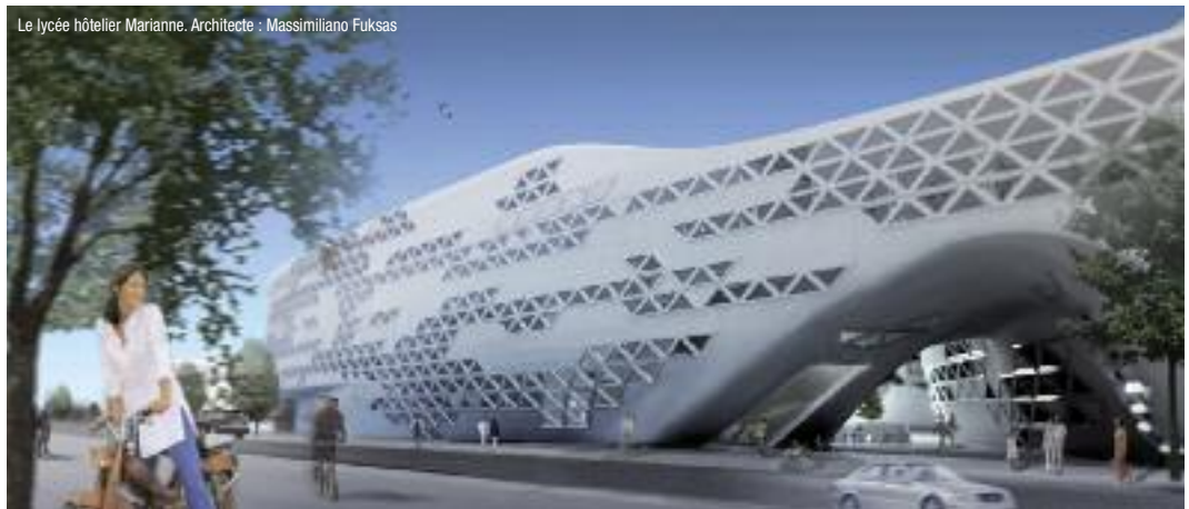
Le lycée hôtelier Marianne. Architecte : Massimiliano Fuksas