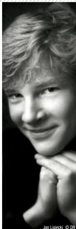
Jan Lisiecki