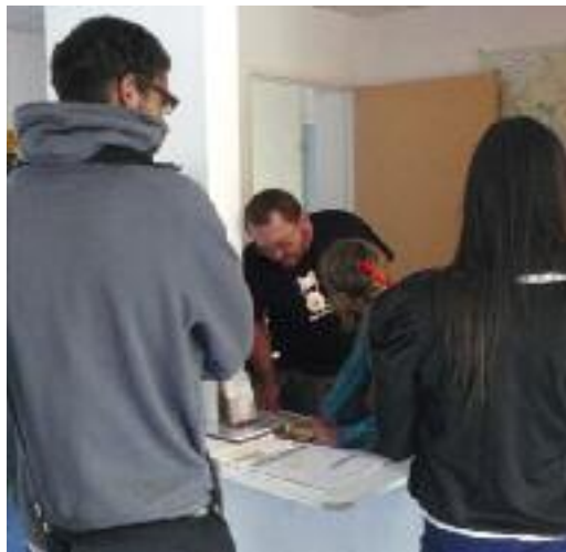
Découverte et sensibilisation aux métiers du Tourisme, Hôtellerie-restauration à l'antenne Mosson de la MLJAM

Une fois ces quelques freins levés, les métiers du Tourisme offrent des carrières passionnantes, avec des parcours superbes. Et de nombreuses possibilités d'évolution dans les années à venir, à condition d'être mobile. Avec notamment la place grandissante qu'occupe le numérique dans l'information touristique. Où la découverte de la destination, l'achat des prestations d'hébergement et de loisirs se font de plus en plus souvent par internet. Nécessitant la mise en place de nouveaux diplômes et formations appliquées à ces filières. Et élargissant pour encore longtemps les perspectives d'emploi dans un secteur sans cesse en train de se renouveler et se diversifier.