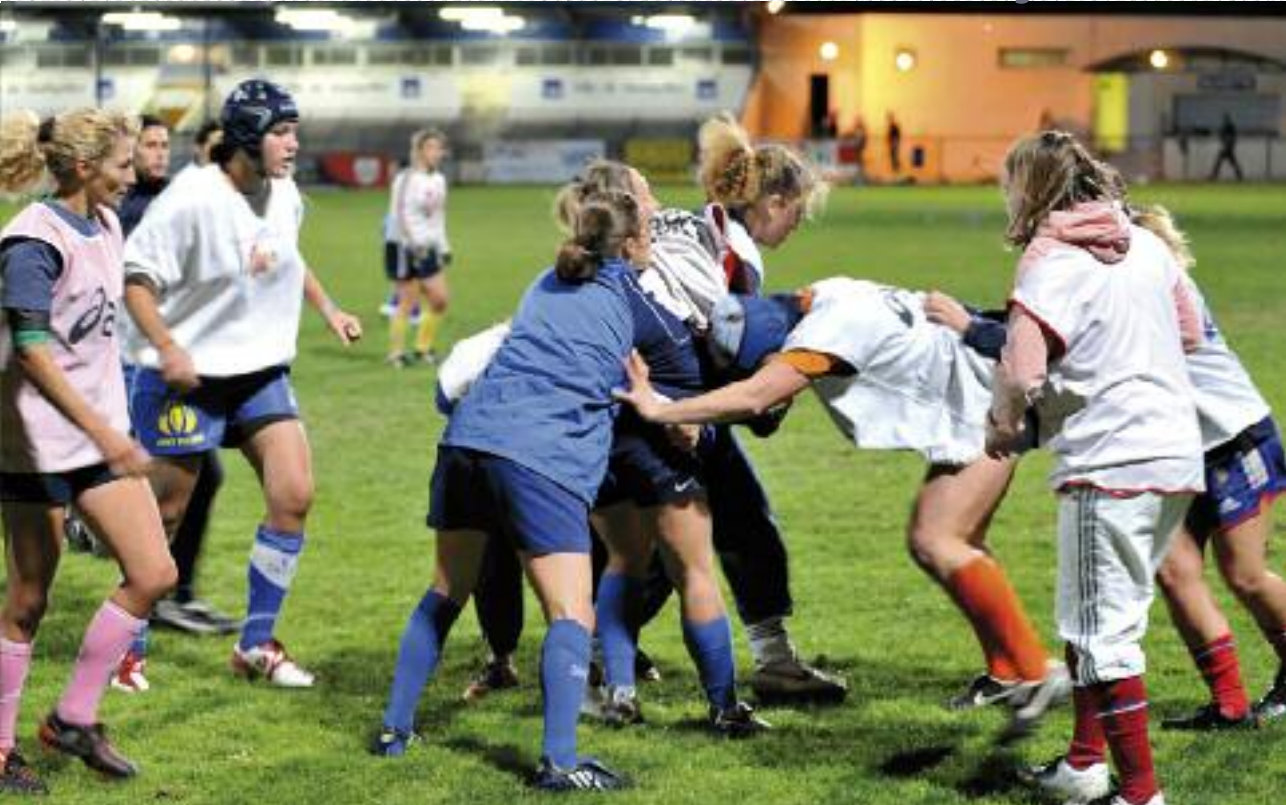
Une invitation pour le 1 er match du top 10 Français du rugby féminin

V ous avez entre 12 et 29 ans ? Vous habitez à Montpellier et vous vous demandez comment vous allez occuper votre été ?