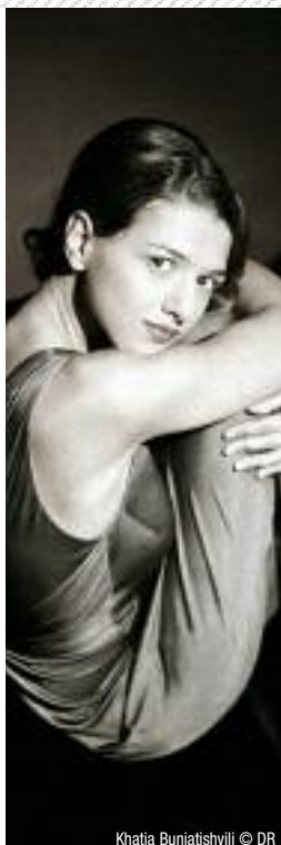
Khatia Buniatishvili