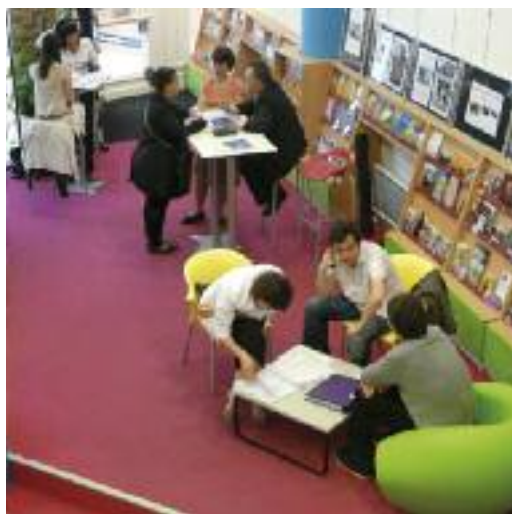
Café-Métiers Tourisme, à l'Espace Montpellier Jeunesse