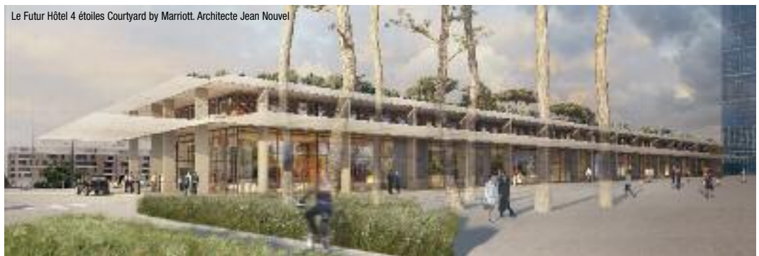
Le Futur Hôtel 4 étoiles Courtyard by Marriott. Architecte Jean Nouvel