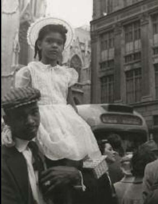
New York - 1957