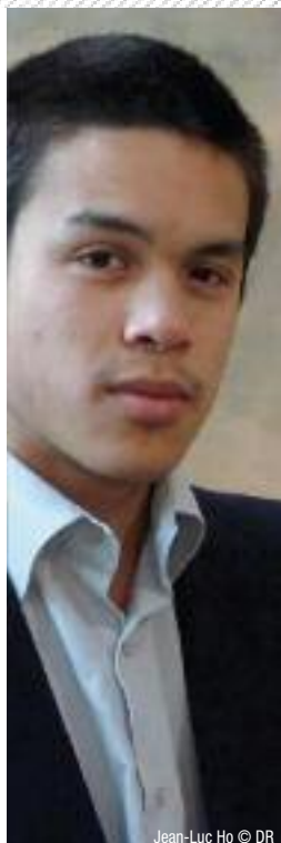
Jean-Luc Ho © DR