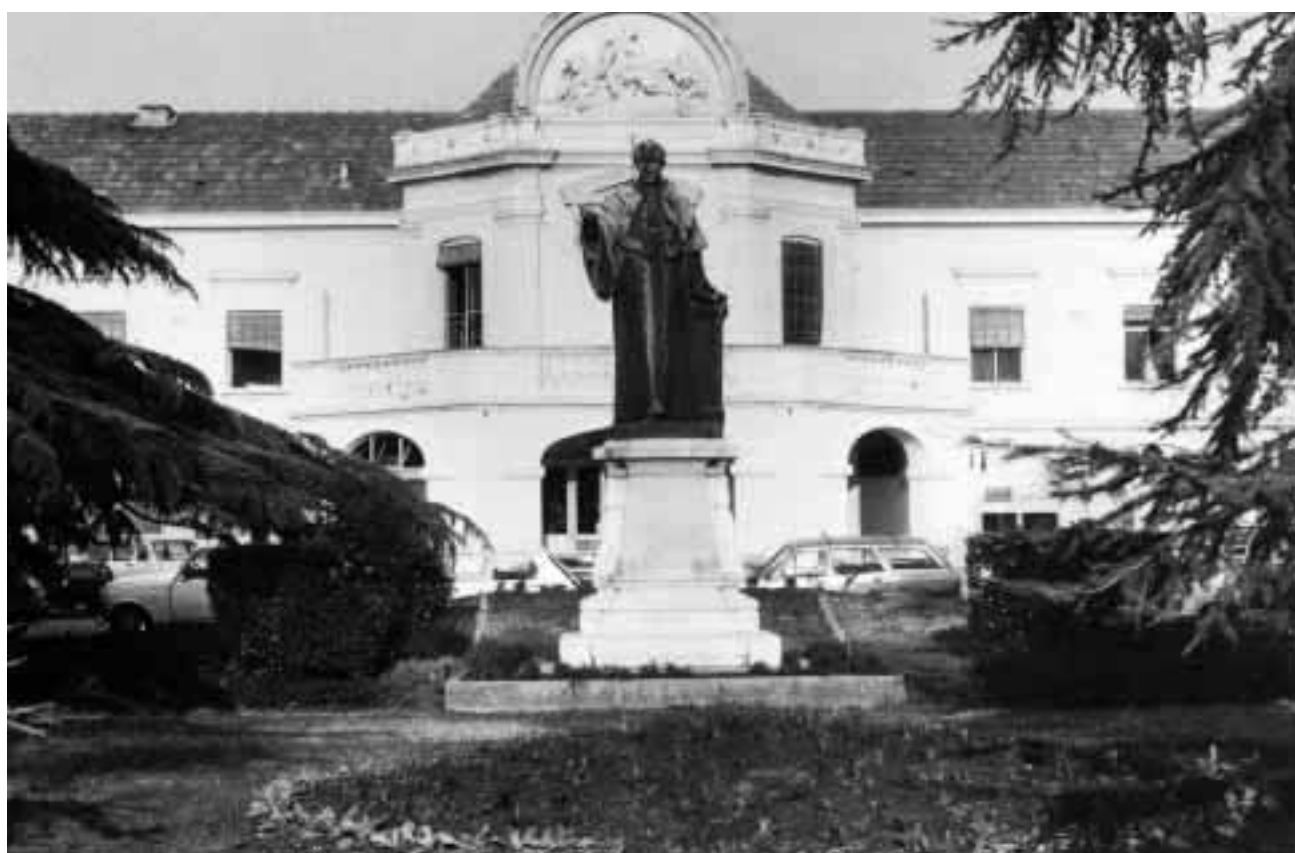
L'hôpital suburbain de Montpellier. Ici, la façade du pavillon central avec la statue de bronze de J-M DELPECH (photo extraite du livre "Les hôpitaux de Montpellier et leur histoire" par Louis DULIEU et Amédée-Charles CRUZEL)

A partir des années 50, l'exode de la population rurale vers la ville, l'arrivée des Français d'Algérie et l'implantation de nouvelles entreprises, décident les élus à urbaniser cet espace. Sont alors construits la Faculté des sciences, puis celle des lettres suivie d'un IUT, du CNRS, de l'UFR des sports et plus récemment de l'école d'architecture. Dans le même temps, le domaine de la santé s'agrandit avec la création de l'hôpital Gui de Chauliac, de l'institut d'hématologie Jeanbrau. De nouveaux lotissements et résidences sont nécessaires pour accueillir une population jeune, diversifiée et dynamique. La première résidence a été celle des Pins suivie du lotissement