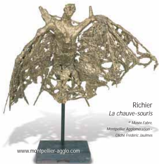
Richier La chauve-souris

Germaine Richier meurt à Montpellier en 1959 au faite d'une reconnaissance internationale.