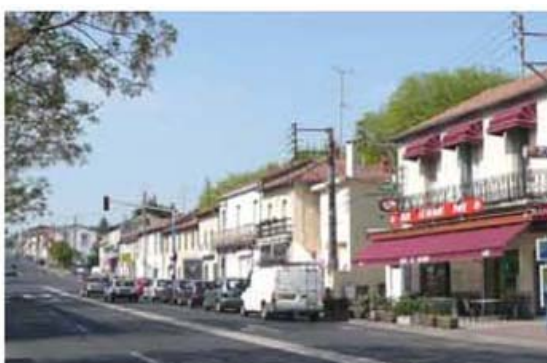
Constructions bordant l'avenue de Toulouse