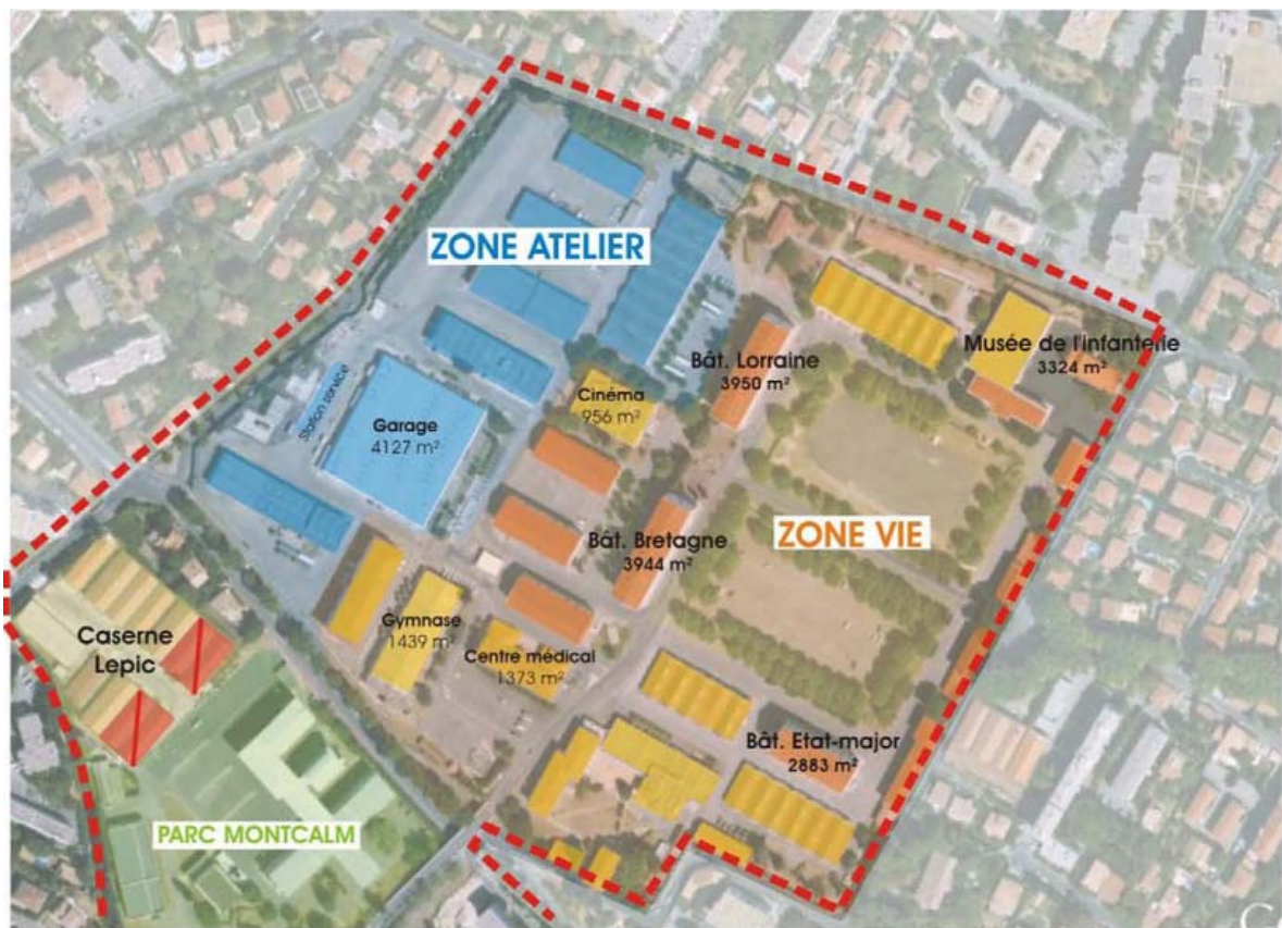
Plan de masse de la caserne Guillaut