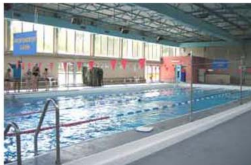
Le pôle sportif : La piscine