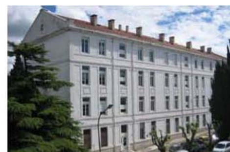
La zone « vie » : Les bâtiments Lorraine et Bretagne