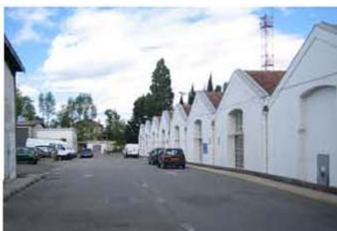
La zone « atelier » : le garage et les entrepôts