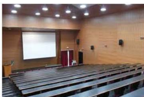
Le pôle instruction : La médiathèque et un des deux amphithéâtres -bâtiment Gallieni