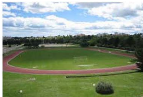
Le pôle sportif : Le parcours du combattant et la piste d'athlétisme