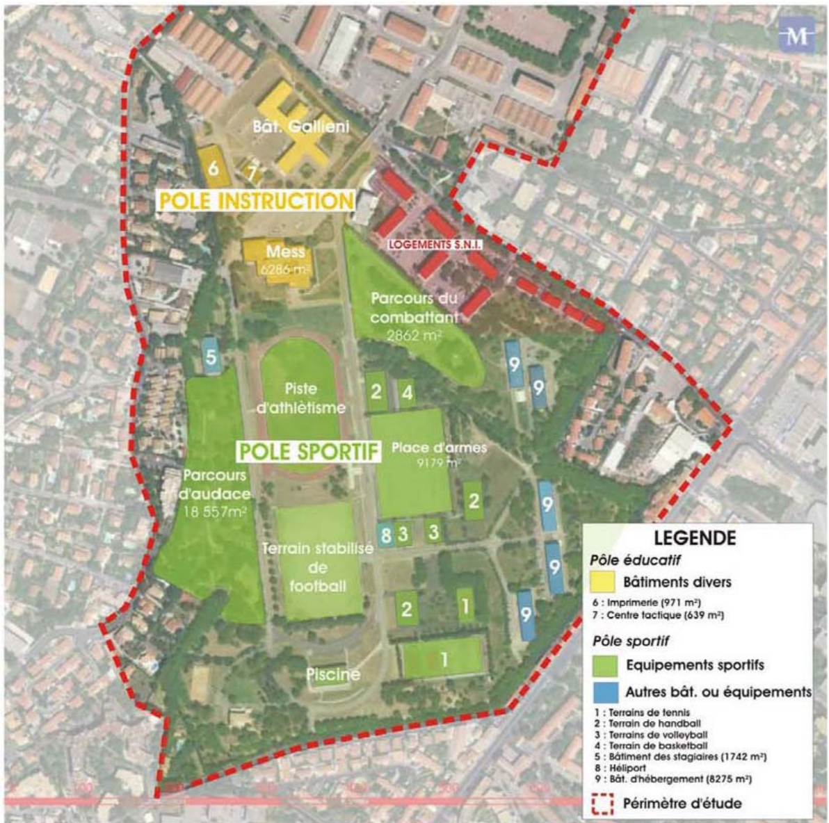
Plan de masse du parc Montcalm