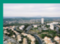
Site des Tirons avant et après démolition