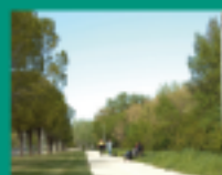
Coulée verte du Rioutor