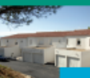
Courti de Nice