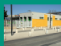
Groupe scolaire Oxford