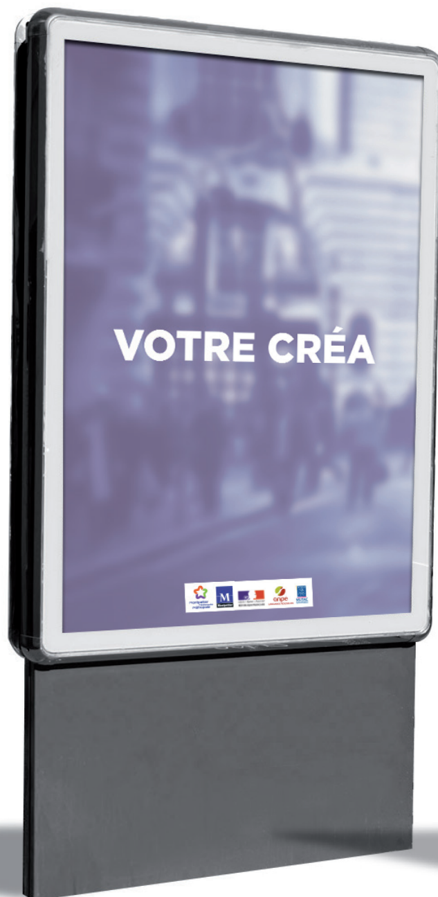
Logos utilisés en quadri