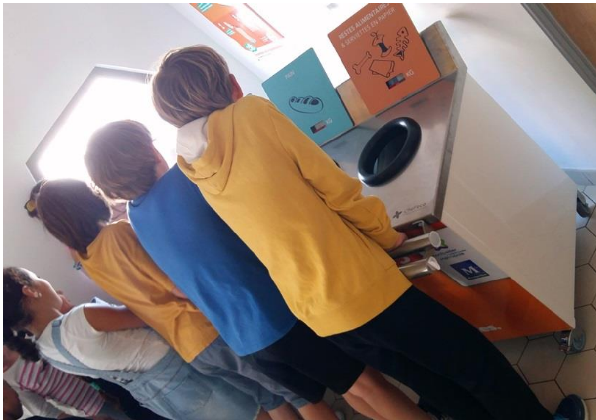
Une table de tri à la cantine.

Afin de sensibiliser au plus près, à la fois les personnels et les élèves, deux tables de tri avec pesée intégrée ont été achetées par la Ville de Montpellier. Véritables outils pédagogiques et ludiques, elles ont été mises à disposition des six restaurants scolaires pilotes du plan de lutte contre le gaspillage alimentaire d'avril à juin 2017 (1 table de tri, pendant 1 mois, dans chaque restaurant scolaire). Afin de permettre à l'ensemble des restaurants scolaires de la Ville de bénéficier de ce dispositif, deux tables supplémentaires vont être achetées d'ici la fin de l'année.