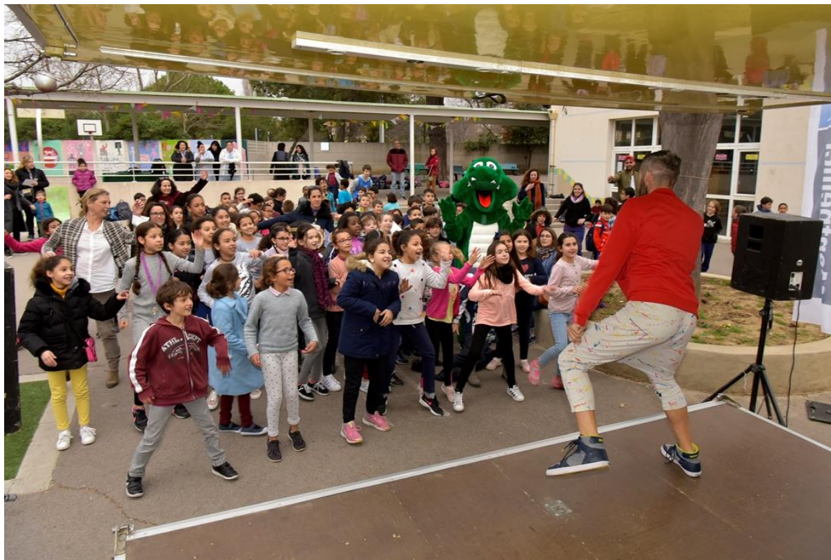
Promotion de l'activité physique à l'école Alain Savary.