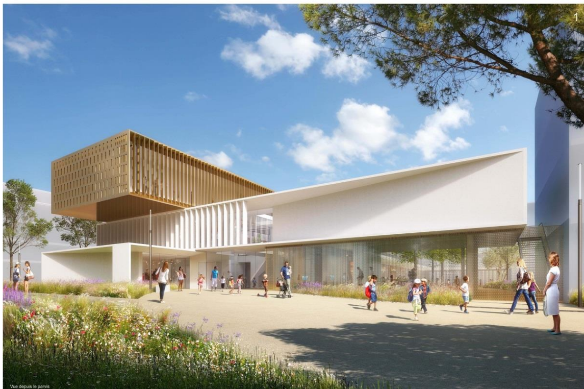
Perspective du groupe scolaire Germaine Richier, vue depuis le parvis – Crédit photo : Agence d'architecture MDR