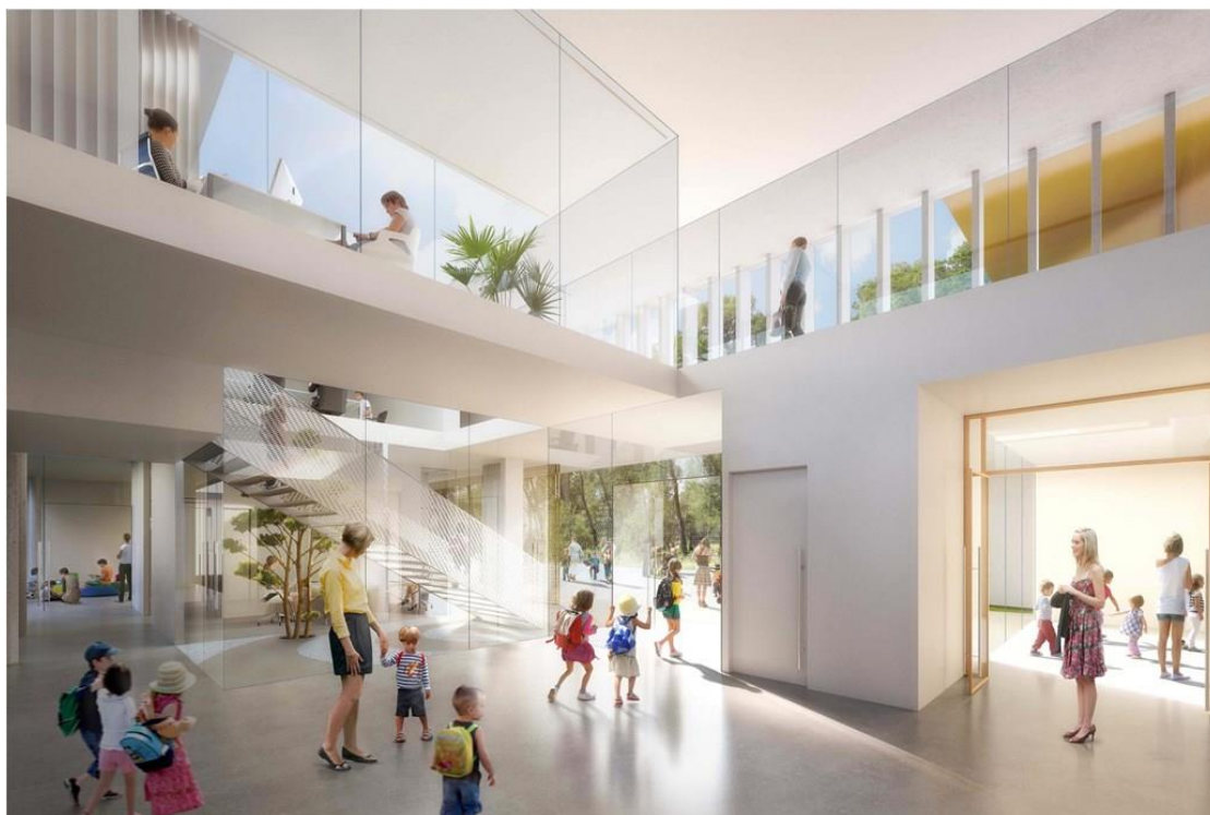
Perspective du groupe scolaire Germaine Richier – Crédit photo : Agence d'architecture MDR