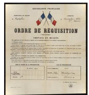
12 Fi 75 Ordre de réquisition de chevaux et mulets (s.d.)

Véhicules automobiles, réquisitions : ordres de réquisition, minutes du commissariat, actes de notifications, correspondance, listes des propriétaires de véhicules ; remboursement : correspondance, bordereaux d'envoi ; réclamations : correspondance (1914-1918, 1921).