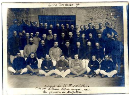
12 Fi 84 Musique du 56e RA

Installé à Montpellier depuis 1905, le 81 e RI occupe la caserne des Minimes cours Gambetta. Il part le 7 août de Montpellier pour rejoindre Mirecourt en Lorraine. Il participe notamment à la bataille de Morhange et à la défense de Lunéville (18-23 août 1914), journées parmi les plus meurtrières de la guerre.