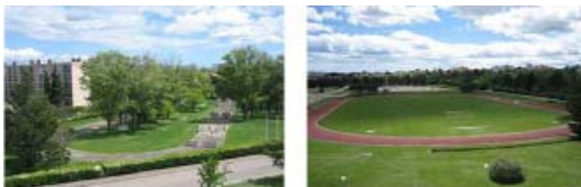
Le pôle sportif : Le parcours du combattant et la piste d'athlétisme

Le parc Montcalm sera également ouvert au grand public dès le 1 er janvier 2011. Cet espace de 26 hectares constitue un élément majeur mais méconnu du patrimoine naturel et paysager de la ville. Il est traversé par le Lantissargues, un ruisseau majoritairement souterrain qui coule à l'ouest du centre-ville et se jette plus au sud près de l'étang de Pérols.