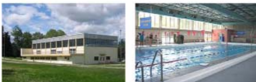
Le pôle sportif : La piscine